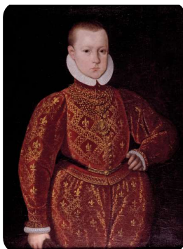
Chr. IV 1585 - 8 år Venligst udlånt af:

Hans lærer var magister heldige omstændigheds og teenagerens 840 opgaver blev det undervisning var pædagogiske tænkning, fik opgaver i brevform, der tanker.