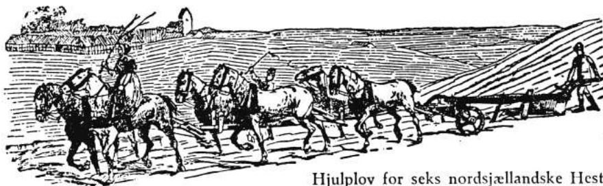
Hjulplov for seks nordsjællandske Heste

Ferlegaard i landsbyen Ferle ved Dronningmølle. Gården er ligesom næsten alle Ferles gårde nedrevet og erstattet med nye bygninger. Pennetegning af Arnold Olsen fra 1939.