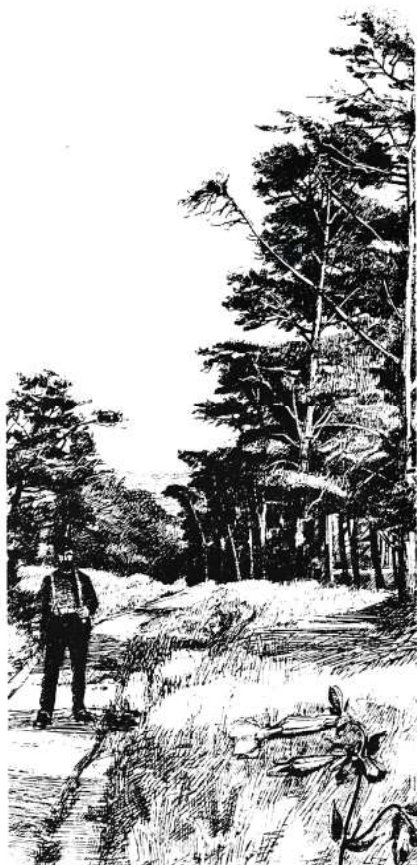
I Hegnet ved Tidsvilde

af flyvesand, beregner conductøren at være en afgang i hartkornet på 2\frac{1}{2} td.. Siden den ej alene har ødelagt overdrevet