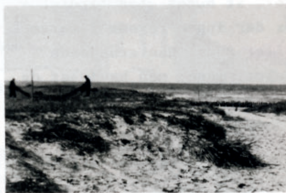
Udsigt mod molen fra den gamle e- getræsbank ved fiskernes stråttækte ishus. Foto ca. 1940.

Dengang havde kun få af Lise- lejes sommerhusejere vandværk-