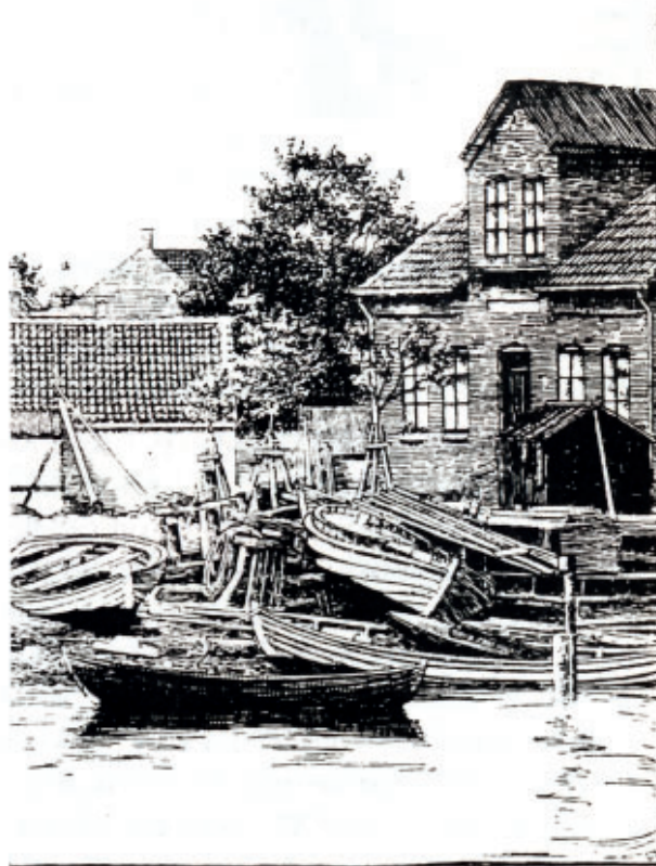
Parti fra havnen ved bygaden i Frederikssund omkring 1880.

Redigeret og udskrevet af Lars Bjørn Madsen 1992.