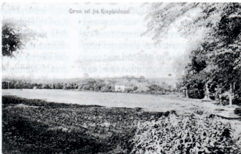
Udsigt fra Esromvejen for foden af Tingbakken ned over marken mod Esrum. til højre ses udkanten af den lille skov, som af de lokale kaldes Esrom Lund. Postkort fra 1908.

meget ulækkert krus, hvori alle kaffesjatterne blev hældt på, så hun kunne drikke af det dagen igennem. Jeg fik min saft serveret i et meget fint glas, og så var der småkager til. Vi blev nu sat ved bordet, far og Karl i sofaen og jeg på stolen, der kradsede. Selv tog hun plads på sin stol i køkkenet. Nu nærmede vi os vort ærinde. Far havde et slags håndværksmæssigt tilsyn med skovens huse, og i den egenskab havde han tidligere på året ansøgt ministeriet om tilladelse til at køkkenerne blev gjort i stand, og vil jeg tro, samtidig afgivet et tilbud på arbejdet. Nu var der så kommet besked, at arbejdet måtte sættes igang til foråret. Det var denne vigtige besked vi var ude med. Så snart den var afleveret, forsvandt Karl ind i soveværelset og kom tilbage med brændevinsflasken. Nu måtte vi have en „lille sort“, sagde han. Brændevinen blev hældt i kaffen og de skålede på den gode nyhed. Da dette officielle budskab nu var overbragt, lænede de to sig tilbage i sofaen og begyndte at tale