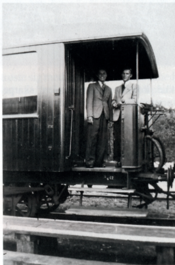
Min bror (t.h.) og jeg på den åbne endeperron på en H.F.J. vogn lige før toget starter fra Melby til Hillerød. Her blev vi stående under hele turen.