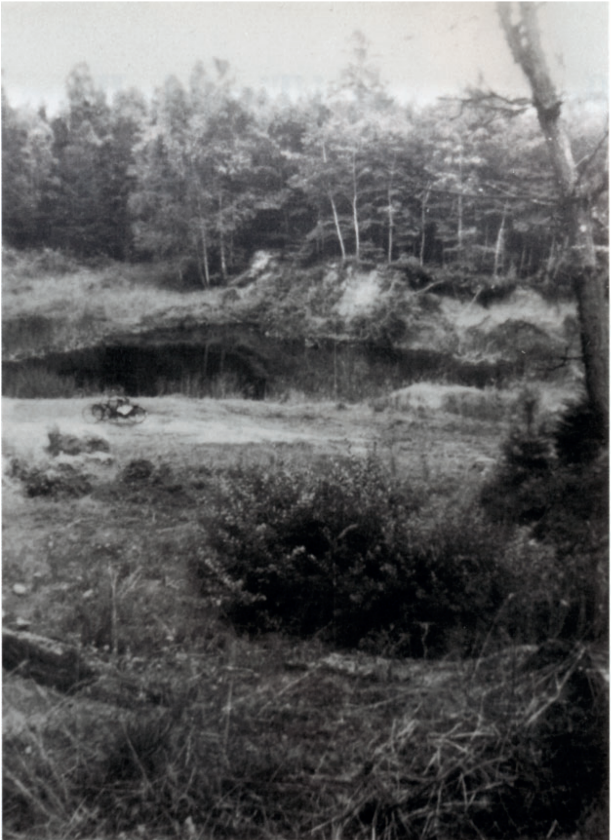
Udsigt mod søen. Til venstre i billedet står to cykler parkeret og foran dem ligger ønskes- tenen. august 1943.