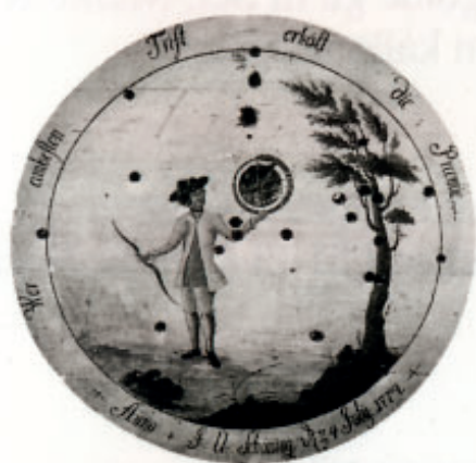
Skive fra 1774 i Helsingørs Kongelig Privilegerede Skydeselskab.