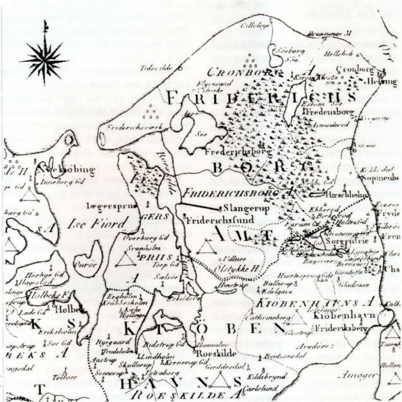
Udsnit af Det Kongelige Videnskabernes Selskabs Kort med Slangstrupkanalen indtegnat.

at blive havneby. Amtmanden vidste godt, at planen var den rene utopi, hvad han sikkert også hurtigt meldte tilbage til Kanal-direktionen.