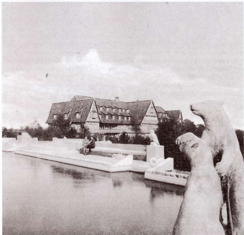
Asserbohus Lido (Frederiksværkegnens Museum)