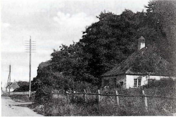
Den gamle smedje markerer skellet mellem Hellebæk og Ålsgårde.

Intet tyder dog foreløbig på, at Helsingør Kommune har i sinde at efterkomme Ålsgårdeborgernes ønske.