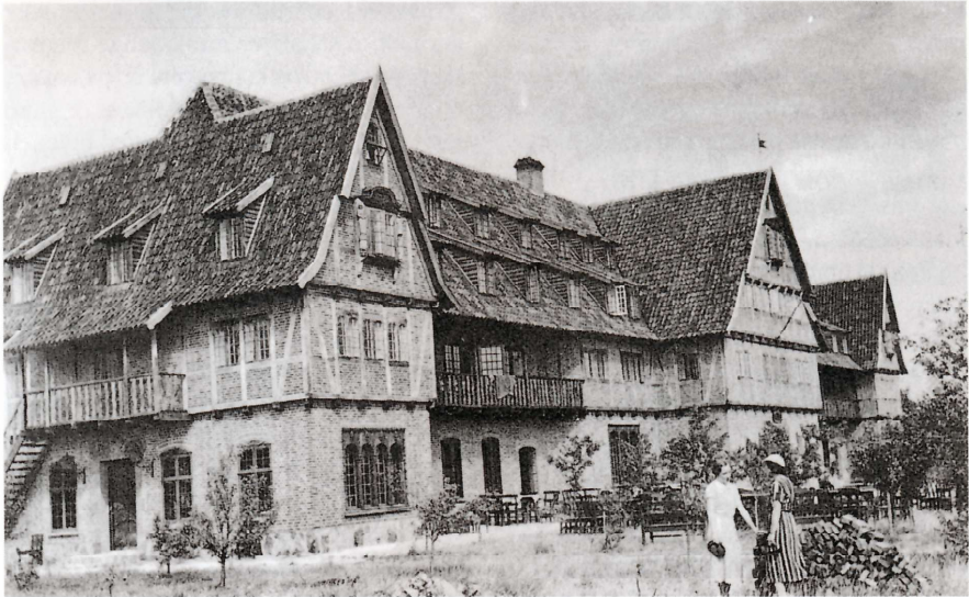
Asserbohus (Frederiksværkegnens Museum)