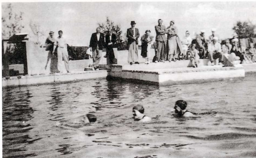
Svømning på Lidoen (Frederiksværkegnens Museum)