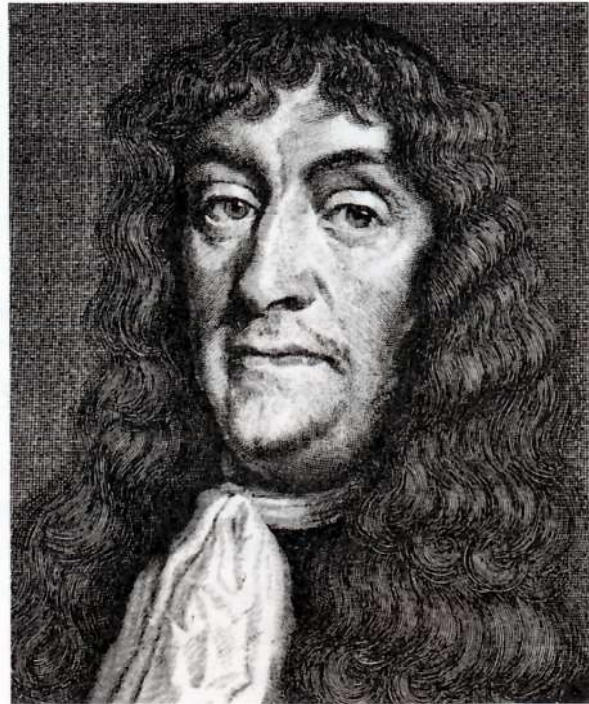
Eiler Holck, del af kobberstik. Gengivet efter Jørgen Sthyr „Kobberstikkeren Albert Haelwegh“, Gyldendal 1965.

Der er flere forklaringer på, hvorfor regimentet havde repræsentanter fra et så bredt udvalg af lande: Krigerhåndværket var internationalt, og man tog tjeneste, hvor man kunne få den bedste sold. En del af de udenlandske soldater var dog givetvis overtaget fra de svenske hære, der var formeret under 30-årskrigen i Tyskland eller i Karl Gustavs krige i 1650'erne – det gælder således tydeligvis det store antal polakker, der