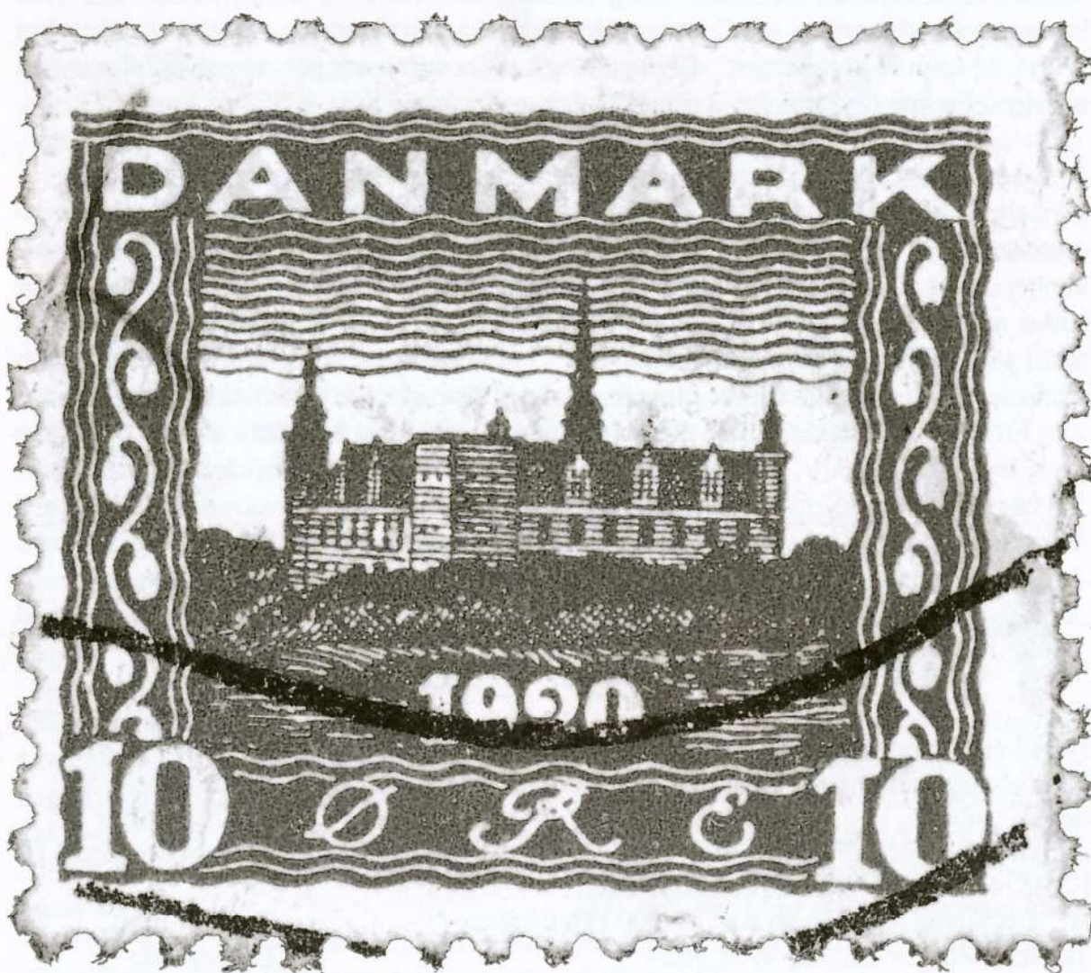
Kronborg Slot i 1500-tallet. Genforeningsmærke, 10 øre rød. Tegnet af Valdemar Andersen og udgivet 5. oktober 1920.