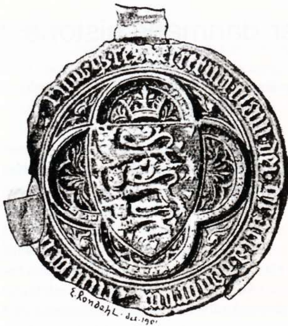
Kong Oluf 3.s våben fra 1376. Første danske våbenskjold med kongekrone over.

fabeldyr eller „rigtige“ dyr som løver og ørne. De enkle figurer var beregnet på at kunne opfattes hurtigt, på lang afstand og måske i kamptummel. Våbenmærkerne blev efterhånden arvelige inden for slægten, ligesom der med tiden opstod et fast og detaljeret system for mærkernes udformning og brug.