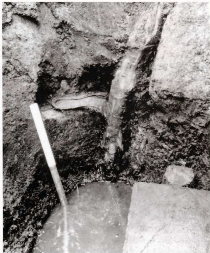
Pælen med den nedpressede skosål. Nederst til højre ses en af de store egetræsstolper.