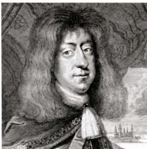
Kong Christian 5.

Jagten foregik som oftest om formiddagen som parforcejagt, datidens yndede jagtform: Når hundene havde opsporet en hjort, blev den forfulgt til den segnede, hvorefter jægeren kunne give den nådestødet med sin hirschfænger. Efter formid-