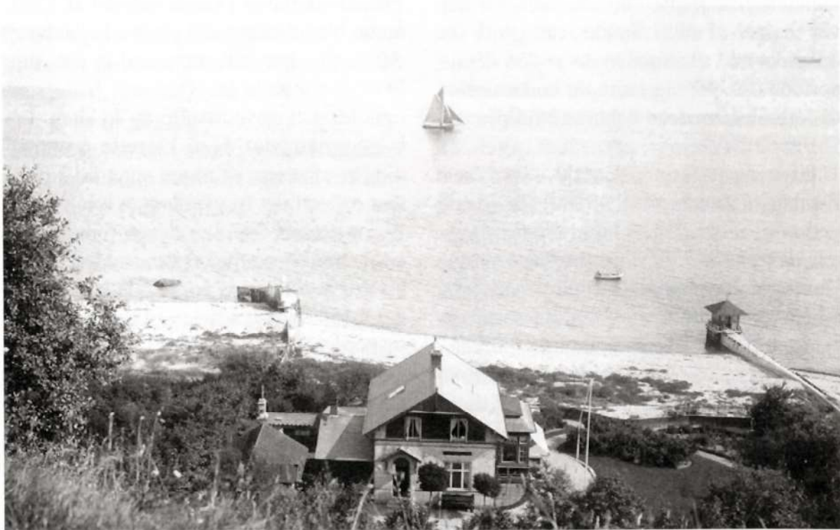
Boderne, Villa Barbicaja, Ndr. Strandvej 232 i 1898.

Boderne blev aldrig til et stort fiskerleje, og i modsætning til nabolejerne Ellekildes og Aalsgaardes blandede krog- og garnfiskeri, drev man udenfor efterårets sildefiskeri udelukkende fiskeri med kroge, primært efter torsk og kuller. Fra sin båd trak fiskeren op til 1.000 kroge, når der ellers var tilstrækkelig med agn at få. Boderne bestod i 1610 af fire huse, der på det tidspunkt var ganske ruinerede, antagelig fordi fiskeriet var stærkt aftagende, noget der gjaldt alle fiskerlejerne. Også sand-