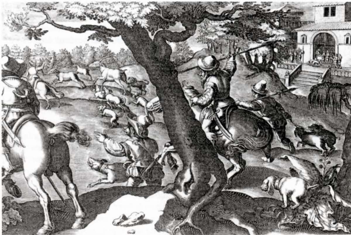
De fines jagt i 1600-tallet. Kobberstik af Th. Galle. Gengivet efter Mogens Espersen: Bomskud og pletskud. 1998.

Jagten på hjortevildt var den mest yndede jagt, og den var som oftest arrangeret som parforcejagt. Hofdagbogen giver oplysninger om i alt 32 parforcejagter i Frederiksborg Amt i perioden 1681-1699.