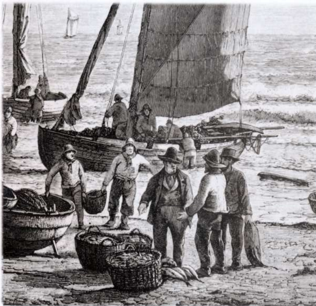
Sildefiskere fra Nordkysten bringer fangsten i land. Udsnit af træsnit i Illustreret Tidende, 1867 (Carl Neumann).

et blad fra Frederiksborg Amts Historiske Samfund