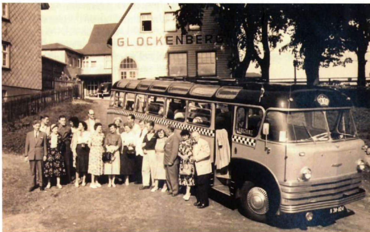
Bus foran Hotel Andreasberg