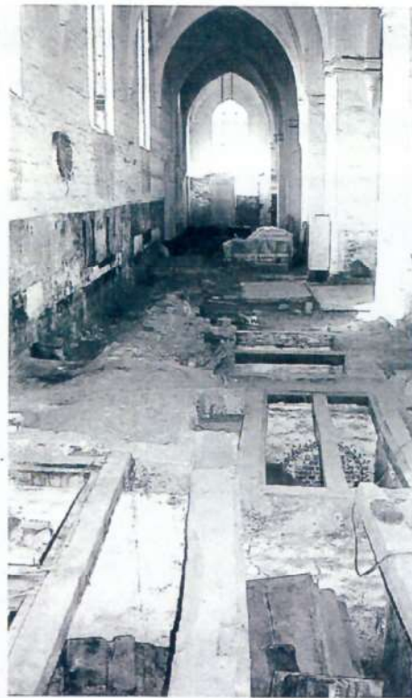
Fotografi fra restaureringen af Skt. Olai Kirke. Forrest ses nogle kistebegravelser

Undersøgelsen af kistebegravelserne i Skt. Olai Kirke er helt unik i Danmark og den har medført at man har fået megen ny viden om Helsingørs borgerskab i 1700-tallet.