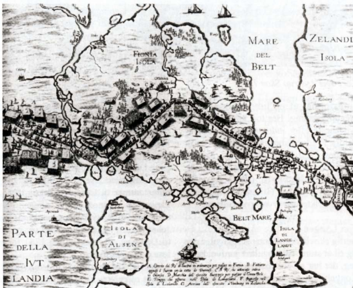
Et samtidigt italiensk stik der viser Karl X Gustavs færd over de slagte danske bælter. Stikket er vældig illustrativt men ikke helt pålideligt hverken når det gælder geografien eller længden af den svenske hær