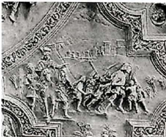
Motiv fra loftet på Sövdeborg Slot

Kl. 08:15 mødes vi på stationsparkeringspladsen, Carlsbergvej i Hillerød. Fra Hillerød kører vi direkte til Øresundsbroen, fortsætter ad hovedvejen via Kirkeheddinge og Dalby og derfra videre ad den skånske Marguriterute langs foden af Rommeleåsen og til Hækkebjerg Slot smukt beliggende på en holm ude i en skovomkranset sø. Vi holder en ganske kort pause for at strække ben, nyde udsigten og dertil eventuelt også en kop god, stærk kaffe. Vi fortsætter ad den skånske Marguriterute til Sövdesjö og Sövdeborg Slot. Her venter slotsfruen os til en omvisning kl. 10:45 præcis i de private sale.