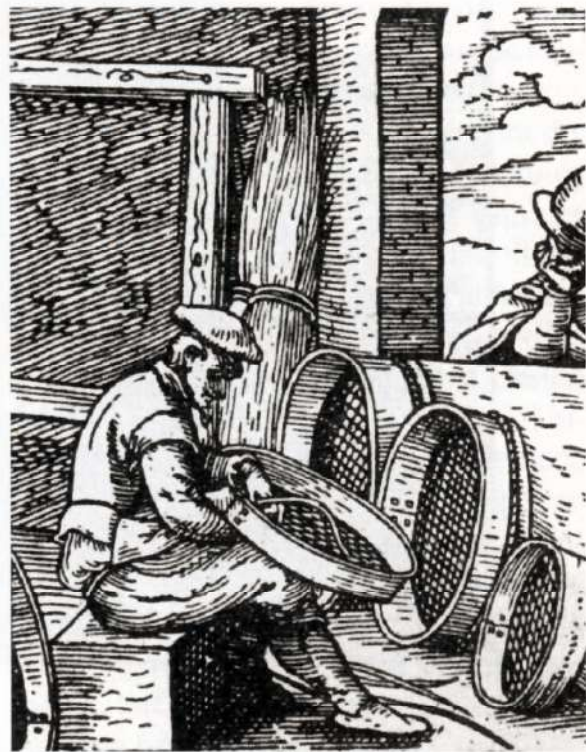
Træsnit af tyskeren Jost Amman (ca.1539-1591)

Sct. Olai Kirke: www.helsingordomkirke.dk