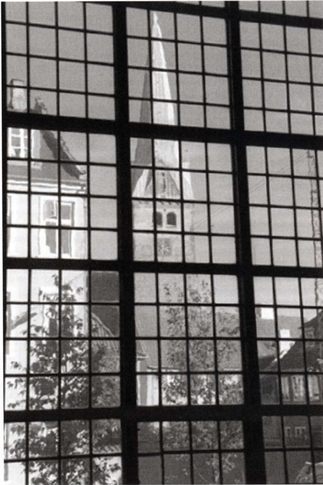
Skt. Olai Kirke set gennem det sydvestlige vindue i Sct. Mariæ Kirke