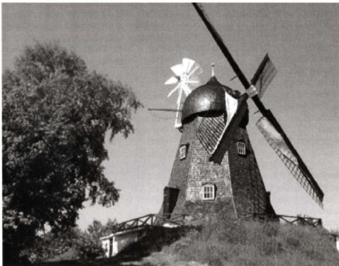
Højsager Mølle.