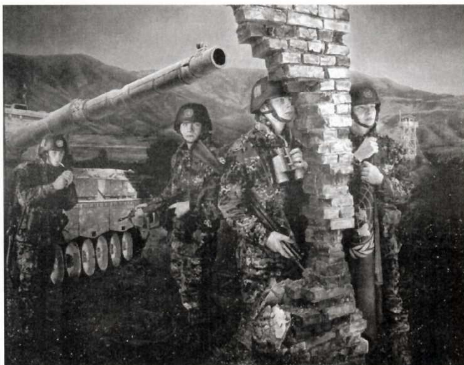
Danske FN tropper i Bosnien 1995. Thomas Kluge. Det nationalhistoriske Museum på Frederiksborg, Hillerød

Artiklen er med forfatterens tilladelse optrykt efter: Noter / Historielærerforeningen for gymnasiet og HF . 2005. Nr. 164.