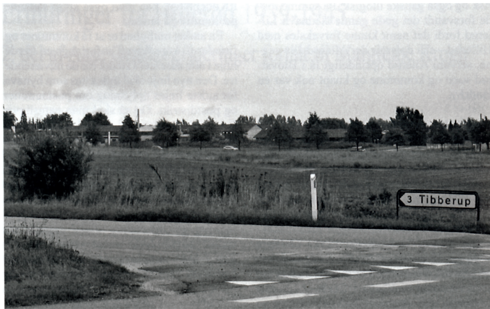
Et par steder står der skilte, der viser til byen Tibberup – men når man kommer frem står der Espergærde på skiltene. Ikke et eneste sted er der et skilt, hvor der står hvor Tibberup begynder eller slutter.

Hillerød, Usserød ved Hørsholm, Vallerød ved Rungsted, Horneby ved Hornbæk, Tibberup ved Espergærde, Øverste og Nederste Torpen ved Humlebæk foruden mange flere.