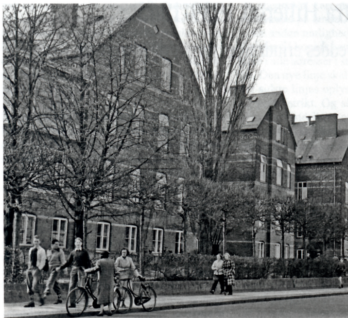
Sygehuset i Hillerød lå på Sdr. Jernbanelvej indtil 1943