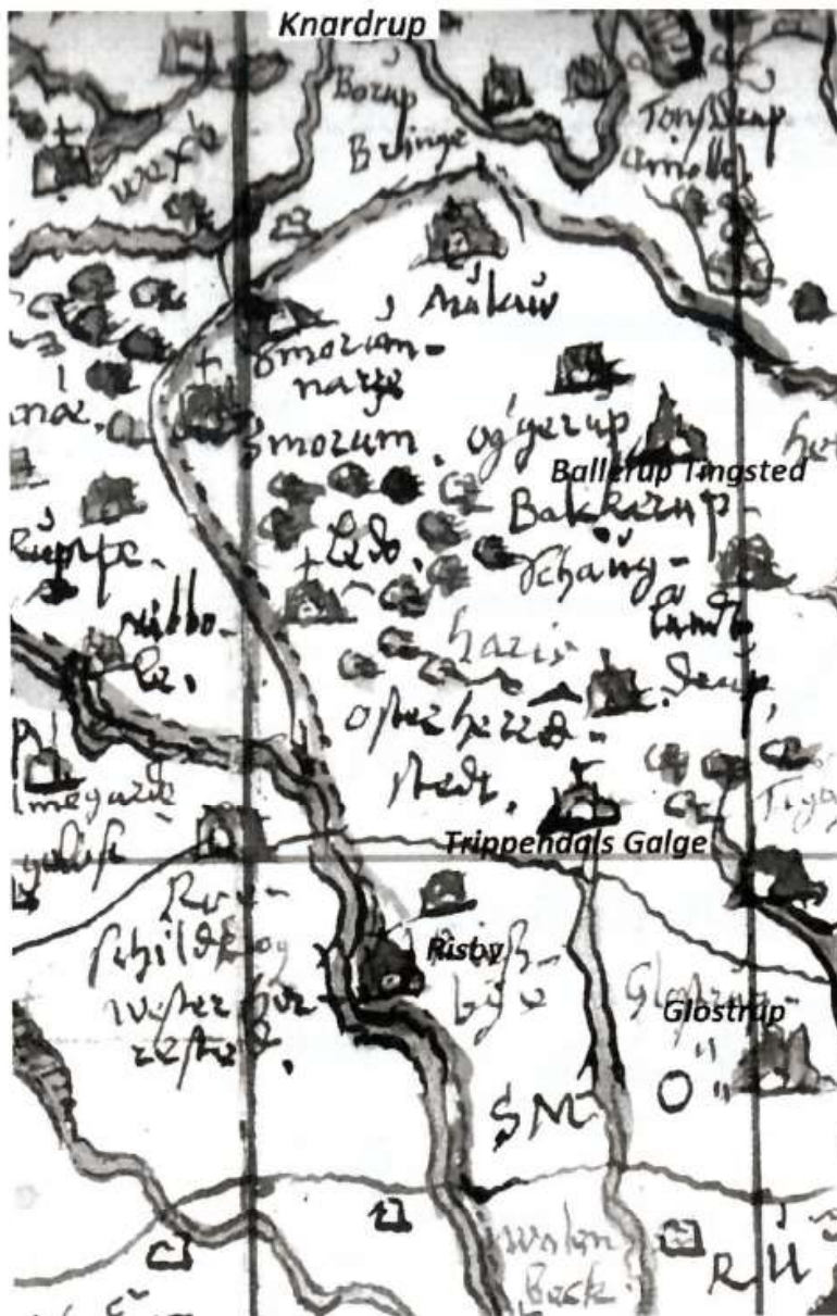
Fig. 3 Udsnit af et håndtegnet kort med titlen: Das Gröste Theill des Ambtes Copenhagen, Anno 1649". Et kort lavet på Christian IV's foranledning ved kartografen Johannes Mejer fra Husum i Slesvig, men aldrig udgivet som tryk. Knardrup er her beliggende øverst, lige uden for kortet. Veksø Kirke ses lidt til venstre herfor med en tydelig korssignatur. Ballerup er markeret som Bakkerup. En helt speciel signatur der må tolkes som "bakke med galge" er vist ved Gl. Landevej, vejen mellem København og Roskilde. Det er den eneste signatur af denne art på dette kort. Beliggenheden passer præcis til kendte beskrivelser af det sted, hvor Trippendals Galge fandtes indtil 1791. Lidt længere fremme mod vest går Gl. Landevej "gennem Roskilde Kro". Der er derfor utvivlsomt tale om galgestedet Trippendal hørende til herredstinget i Ballerup, markeret på det ældste detaljerede kort, som findes over vor egn.