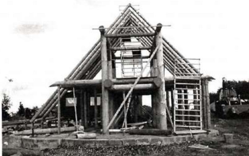
Rundtømmer huskonstruktion i den økologiske landsby Torup