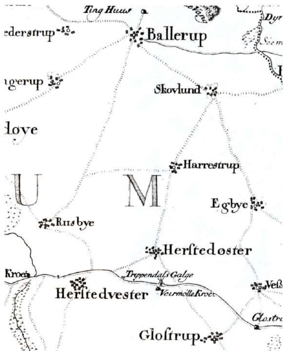
Fig. 2 Udsnit af et detaljeret Sjællandskort udgivet af "Videnskabernes Selskab" i 1766. Det viser ved Ballerup en markering for "Ting Huus" samt ved Gl. Landevej en markering for Trippendals Galge der ligger mellem Veirmølle Kroen lidt vest for Glostrup og Roskilde Kro (som netop kan anes i billedets kant). Efter Stenløse Lokalkiv 2001 - 874.

Trippendal var i brug som rettersted fra slutningen af 1500 - tallet til 1791 og der var i 1766 ikke markeret andre galgesteder i Nordsjælland på kort. Tilmed kan det nu påvises, at Trippendals Galge allerede er markeret i 1646 (Fig. 3), 120 år tidligere.