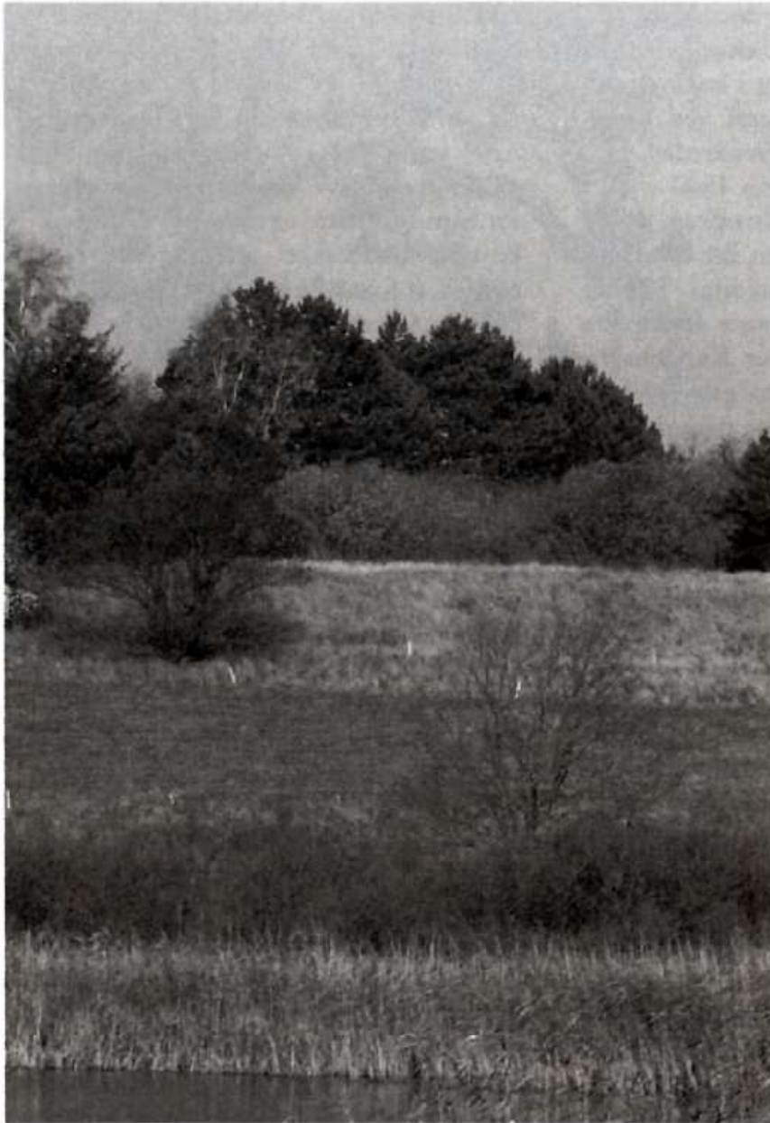
Landskabet ved Kirkesø i Knardrup med Galdebakke i baggrunden, fotograferet mod nord.

ter anses for sandsynligt, at der aldrig har været en galge på bakken i Knardrup. Navnet Galdebakken er fra den nære nutid og resultatet af en sproglig forvanskning. Pænerne sagt og måske mere korrekt - resultatet af en sproglig udvikling. Måske hjulpet godt på vej af en landmåler.