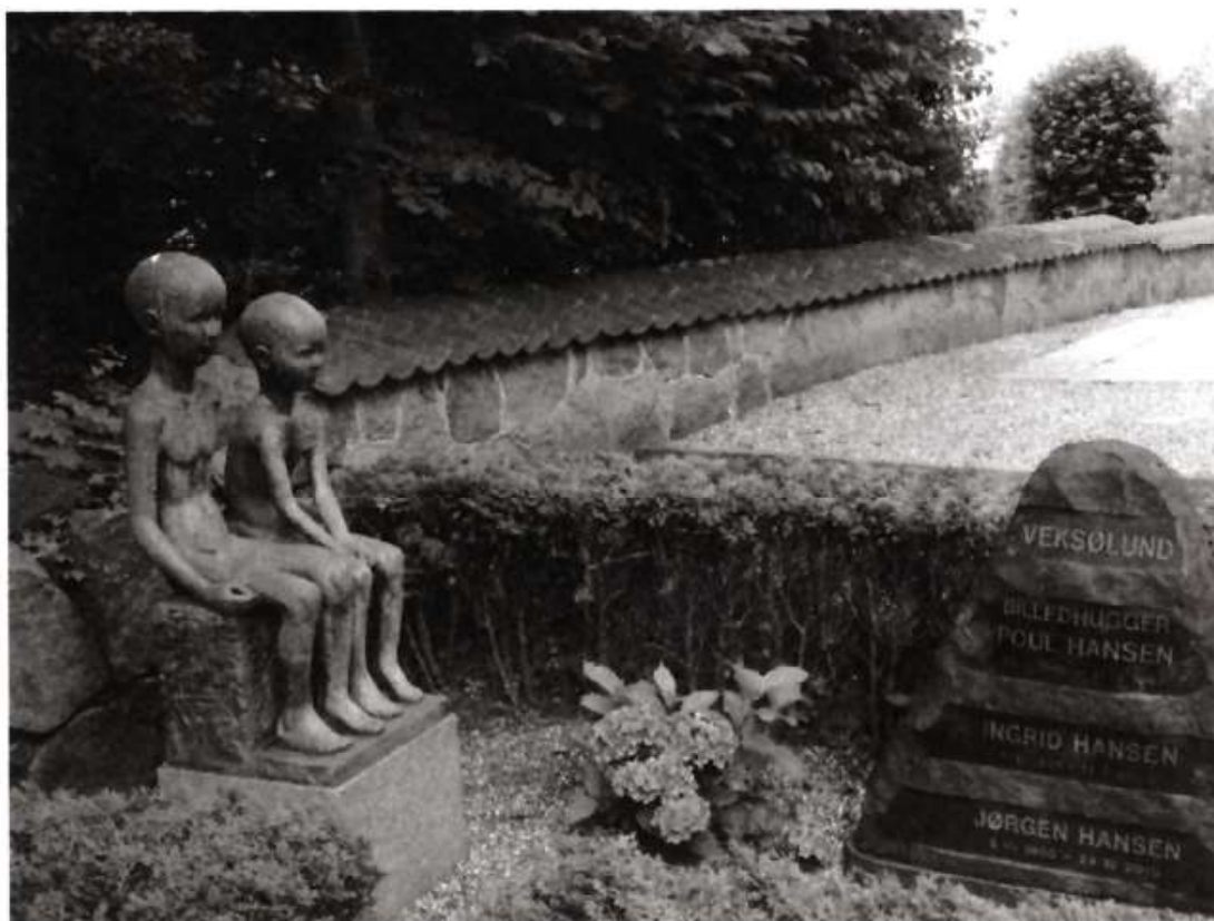
Statuen "Børn" på gravstedet på Veksø Kirkegård