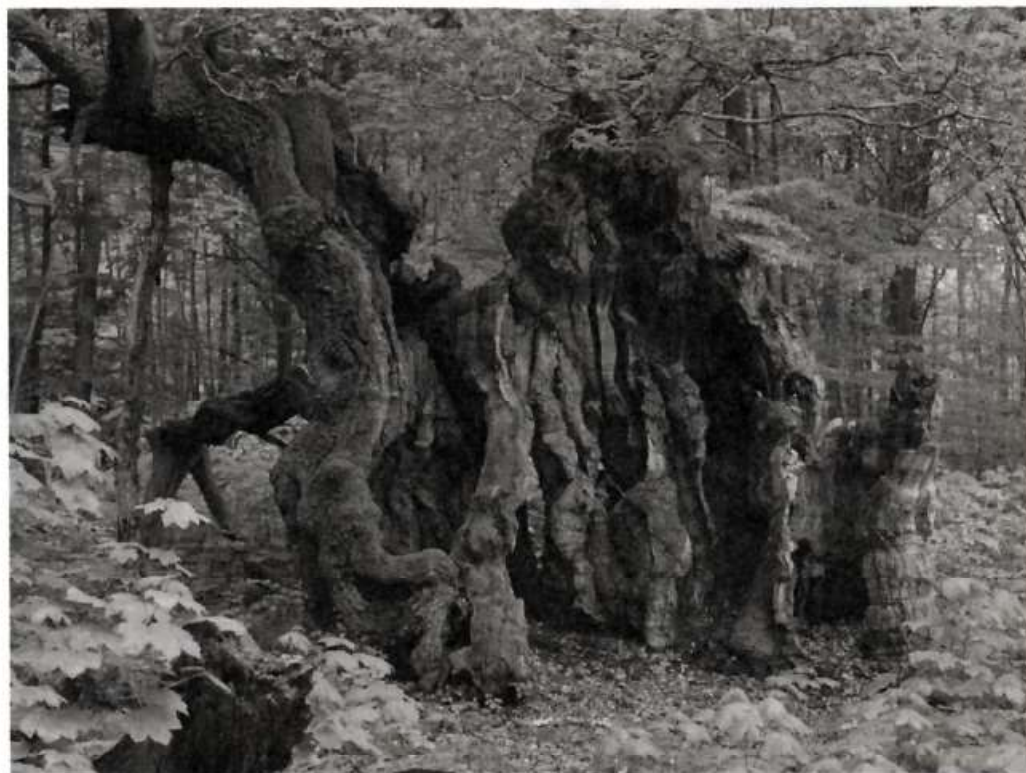
Kongegegen i Nordskoven fotograferet april-maj 2007

Ved enevældens ophør overgik de kongelige slotte til statslig ejendom. Efter sit giftemål til venstre hånd med Louise Rasmussen i 1850, købte Frederik den Syvende i 1854 Jægerspris Slot for at bruge det til bolig for sig og sin hustru, nu lensgrevinde Louise Danner af Samsø. De tog fast ophold på Jægerspris i god afstand fra borgerskabet i København, der var fjendtligt indstillet over for grevinde Danner, som de så som en "opkomling".