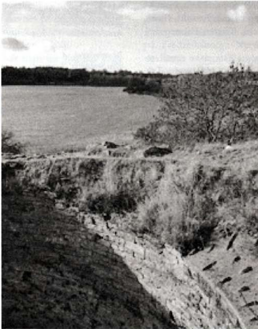
Bastrup Sø set fra Bastruptårnet. I forgrunden en solbelyst del af ruinens indvendige frådstensmur. Søen var i mange år del af grænsen mellem Frederiksborg og Københavns amter.