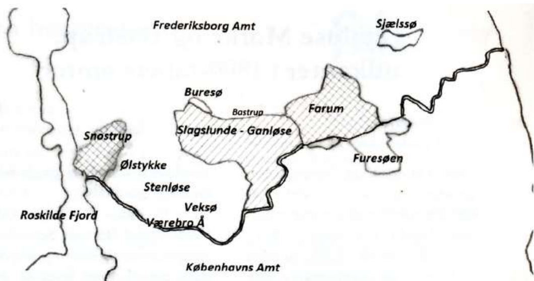
Fig. 1 Amtsgrænsen mellem Frederiksborgs og Københavns amter blev i slutningen af 1700-tallet ændret i flere omgange til det forløb, som vi har kendt indtil fornylig. Denne skitse skal forsøge at illustrere disse forandringer. I 1793 flyttedes det enkeltkraverede område med Slagslunde - Ganløse fra København til Frederiksborg. I 1800 kom de krydsskraverede områder med Farum og Snostrup ligeledes under Frederiksborg. Dette amts sydgrænse kom herved til at følge Værebros Å over en lang strækning. Denne grænse er markeret med en dobbeltstreg. Skitse ved forfatteren.

gelse, idet Snostrup sogn yderst ude, nord for åen hørte under København og ved en tidligere administrativ deling var det oprindelige Jørlunde Herred under Københavns Amt blevet delt. Dette havde medført, at sognene Snostrup og Ølstykke fra det oprindelige herred var forblevet under Københavns Amt, medens Jørlunde var blevet tillagt Frederiksborg Amt. Denne grænse mod Jørlunde er ikke vist på fig. 1. Ved Bastrup og Ganløse - på begge sider af denne grænse ved søerne - havde bønderne overdrev til græsning og gærdsel. Mest markant dog på sydsiden, hvor der var store skovområder, som hørte under Kronen. Skove, hvis rester vi i dag kender som Slags-