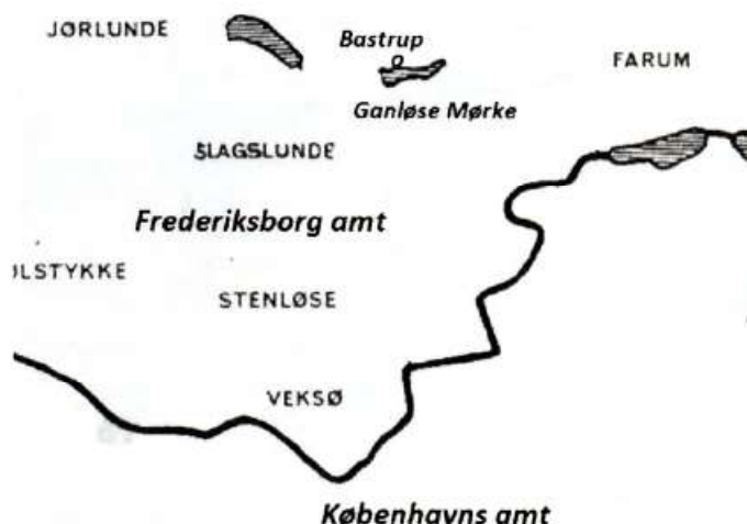
Fig. 4 Den nye amtsgrænse mellem Frederiksborg og København i lokalområdet, som etableredes år 1800. Den fulgte mod syd Værebro Å inde fra området vest for Farum og flyttede et stort område til Frederiksborg. Skitse ved forfatteren.

nien/Projsen i 1795. Udine til freden mellem Frankrig og Østrig i 1797. Rastad til freden mellem Frankrig og Det tyske Rige 1797 - 99. At navnene forekom hyppigt i en dengang førende dansk avis, kan næppe forklare, at de skulle gøres mindeværdige ved at blive tildelt gårde i dette udkantsområde. Og dog!