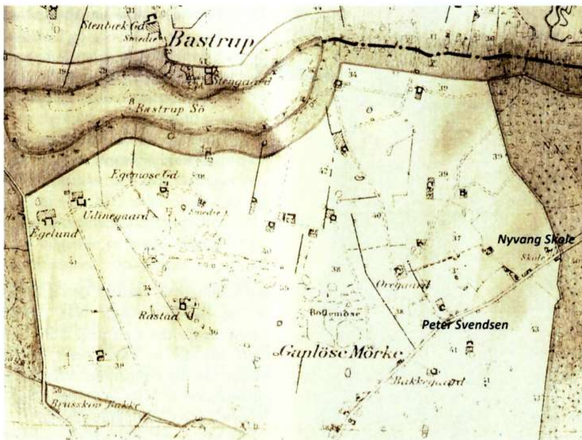
Fig. 3 Kort over Ganløse Mørke. Stenløse Lokalarkiv 2006 - 845/4

og byggede en ny firelænget gård lidt længere mod syd, væk fra søen. Han grundlagde dermed gården, der seks år senere skulle få det mærkelige navn Rastad. De tre udflyttergårde havde i de første mange år et vist driftsfællesskab om enggræsning og tørveskær. Det blev ophævet i 1799, da hver og en fik eget skøde på sin gård som arvefæste og selveje. I den anledning blev gårdene tildelt navne, som har undret eftertiden og da sikkert også de dengang berørte bønder. Det er svært at tro, at de selv har været medbestemende eller blot er blevet spurgt. Navnene fremgår af en protokol fra Frederiksborg Amtsstue af 1799 (3).