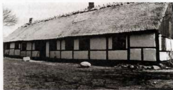
Karlebo gamle Kro. Krovirksomheden går tilbage til 1500-tallet.

denne anmode bønderne om ikke at tale med "løse" ord til ham på den måde. Det havde præsten afvist med den bemærkning, at Anders ikke havde noget med bønderne at gøre. Samtidigt havde præsten slået ham i brystet, så han var faldet til jorden, og da han havde rejst sig igen, havde præsten slået et stort hul i hans pande med et ølkrus. Anders var derefter løbet ud, men han havde derefter prøvet at hale præsten ud af rummet ved at slå et vindue i stykker med sin kære. Herefter var han gået hjem til sit kvarter sammen med kroværten. Også præsten havde villet ud til Anders, men han var blevet forhindret i dette af kapellanen og andre tilstedeværende.