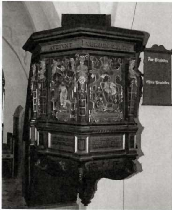
Karlebo Kirkes prædikestol fra 1584. Billedet var bragt i farver i særnummeret fra 2012 af Karlebo Lokalhistoriske Forenings Rytterskolen.

Umiddelbart kan man spørge, hvilke kilder, der angiver, at også Christian Jensen Bircherod blev myrdet? Svaret er et klart: Ingen – absolut ingen: Og tilmed er der flere forhold, der tyder på, at han døde en ganske naturlig