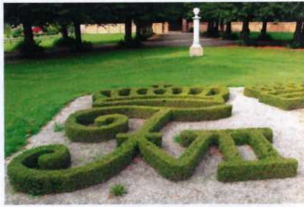
Frederik VII og grevinde Danners smukke initialer i Jægerspris have