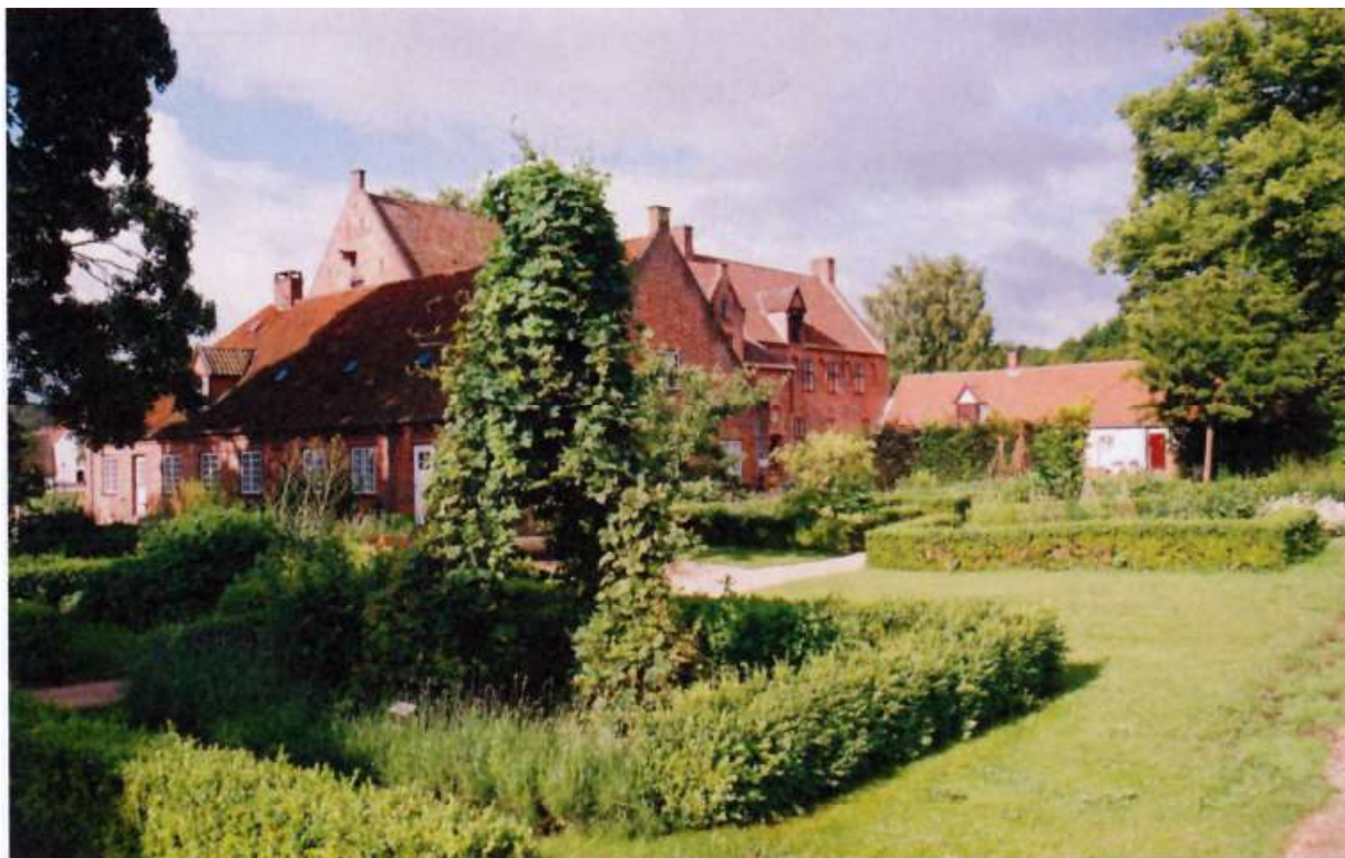
ESRUM KLOSTER med en udsigt fra den moderne urtehave anes det middelalderlige kloster i baggrunden (2011).

kirken i Clairvaux senere udbyggedes med en storslået apsis, der har store ligheder med paradisgården i St. Gallen.