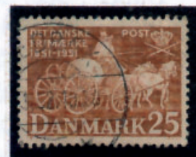
Frimærke udsendt i 1951 100 året for udsendelse af det første danske frimærke.

I 1533 vides det, at der var daglig brevpostforbindelse mellem Helsingør og København, og allerede i 1565 gives der befaling til Jørgen Sehested at holde 2 postklippere ved Krogen (slottet Kronborg), der altid kunne stå rede til straks at føre de fra Skåne kommende breve og bud til kongen (en klipper er en hurtigt sejlene kofardiskib).