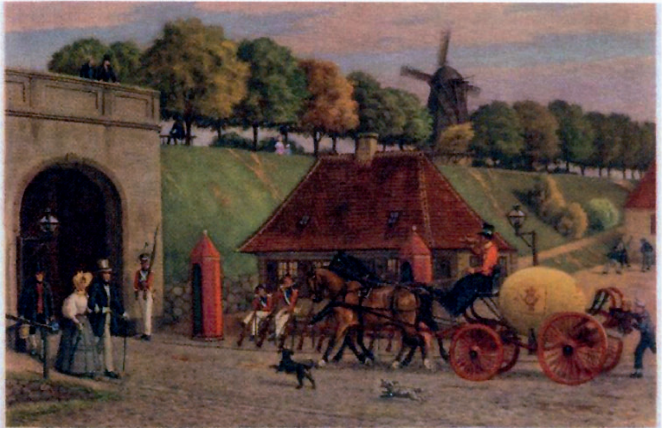
Kugleposten passerer Vesterport ca 1845. Kugleposten kørte mellem København og Altona 1815-1865.