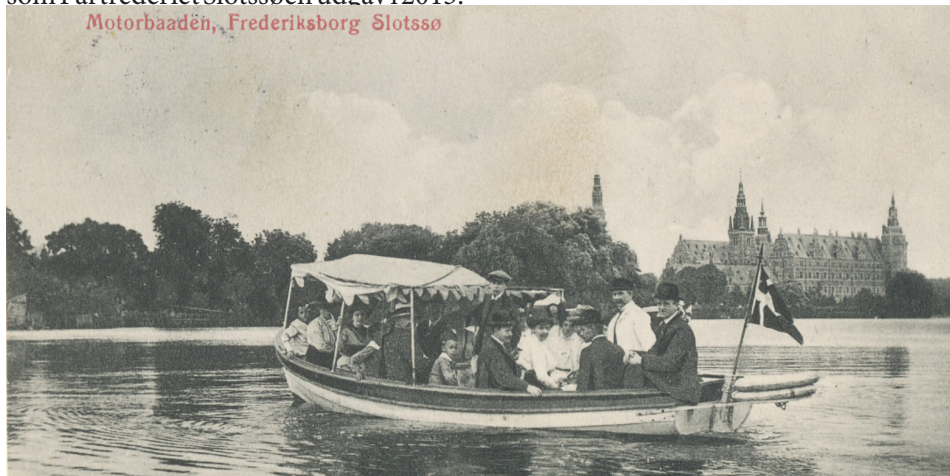
Motorbaaden, Frederiksborg Slotssø

Oprindeligt skulle den lille færge have været bygget som en redningsbåd på Nakskov Skibsværft i 1949, hvor ØK havde bestilt nye redningsbåde til skibet Jutlandia. Men inden redningsbådene blev bygget, kom krigen i Korea, og det blev i december 1950 besluttet, at Jutlandia skulle udrustes som et hospitalsskib og sendes til Korea. Oprindeligt havde Jutlandia plads til 139 personer, men nu skulle der gøres plads til 600 personer, og derfor skulle redningsbådene været noget større end oprindeligt planlagt.