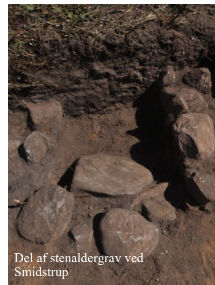
Del af stenaldergrav ved Smidstrup

Da interessen for at drive landbrug langsomt gryr frem i stenalderen, begynder befolkningen at opdyrke de egnede jorder ved bredderne af fjorden og ude ved kysterne, mens store dele af det indre land endnu ligger hen som urskove med kun spredt menneskelig bosættelse. Storvildt og vildt trives også i bedste velgående ved overgangen til bondestenalderen, og de er endnu ikke fortrængt fra deres opholdssteder som følge af en menneskelig ekspansion.