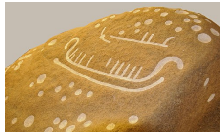
På bronzealderens helleristninger kan man ses mange afbildninger af tidens skibe. Her er Hyllingebjergstenen fra Halsnæs.

Bronzealderens kæmpehøje er for eftertiden nærmest blevet synonym for denne tid, hvilket ikke er overraskende, da tilstedeværelsen af disse høje er gan-