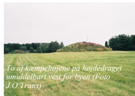
To af kæmpehøjene på højdedraget umiddelbart vest for byen

Ved overgangen til bronzalderen har antallet af gravhøje været få. Stendysserne havde kun været i funktion gennem nogle få generationer, mens jættestuernerne til gengæld havde været i