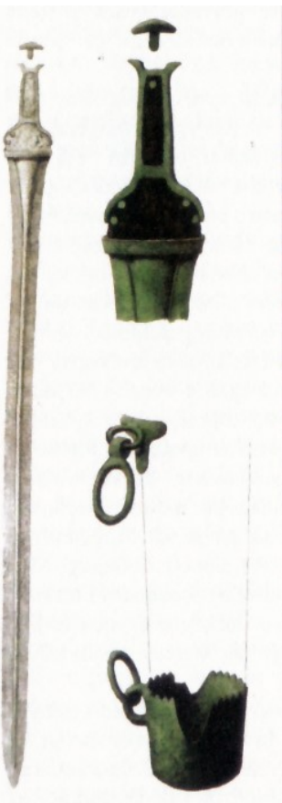
Sværd og beslag til pilekogger fra store Ludshøj.

Koncentrationen af høje er trods alt mest massiv ude ved vådområdet, hvorfor en dyrkning af afgrøder og bestand af græssende kreaturer synes at have været en ledetråd for befolkningen gennem det