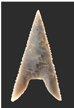
I slutningen af bondestenalderen har flintsmeden udviklet sin teknik til perfektion, som det ses af denne flotte pilespid.

Bønderne havde i det fjerde årtusinde før vor tidsregning taget skridtet