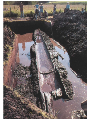
Stenalderbådene var blot udhulede træstammer.

Opførelsen af kæmpehøjene hører en ganske bestemt tid til, og de opføres over et par århundreder fra år 1500-1300 f.v.t. De synes hermed at markere en overgang fra en højkultur, hvor bygdens medlemmer alle som én har været begravet i en fælles høj, til en mere individuelt præget højkultur, men de store kæmpehøje opfø-