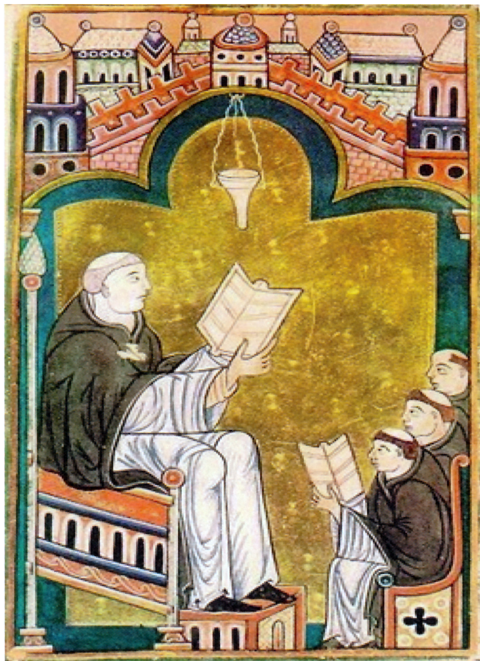
Hugo af Saint-Victor og hans skole.