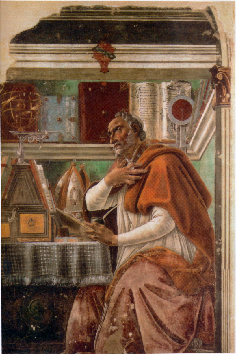
Oldtidsfilosoffen Augustin. (Billedet hænger i kirken Ognissanti i Firenze og er malet af Sandro Botticelli ca. 1480).