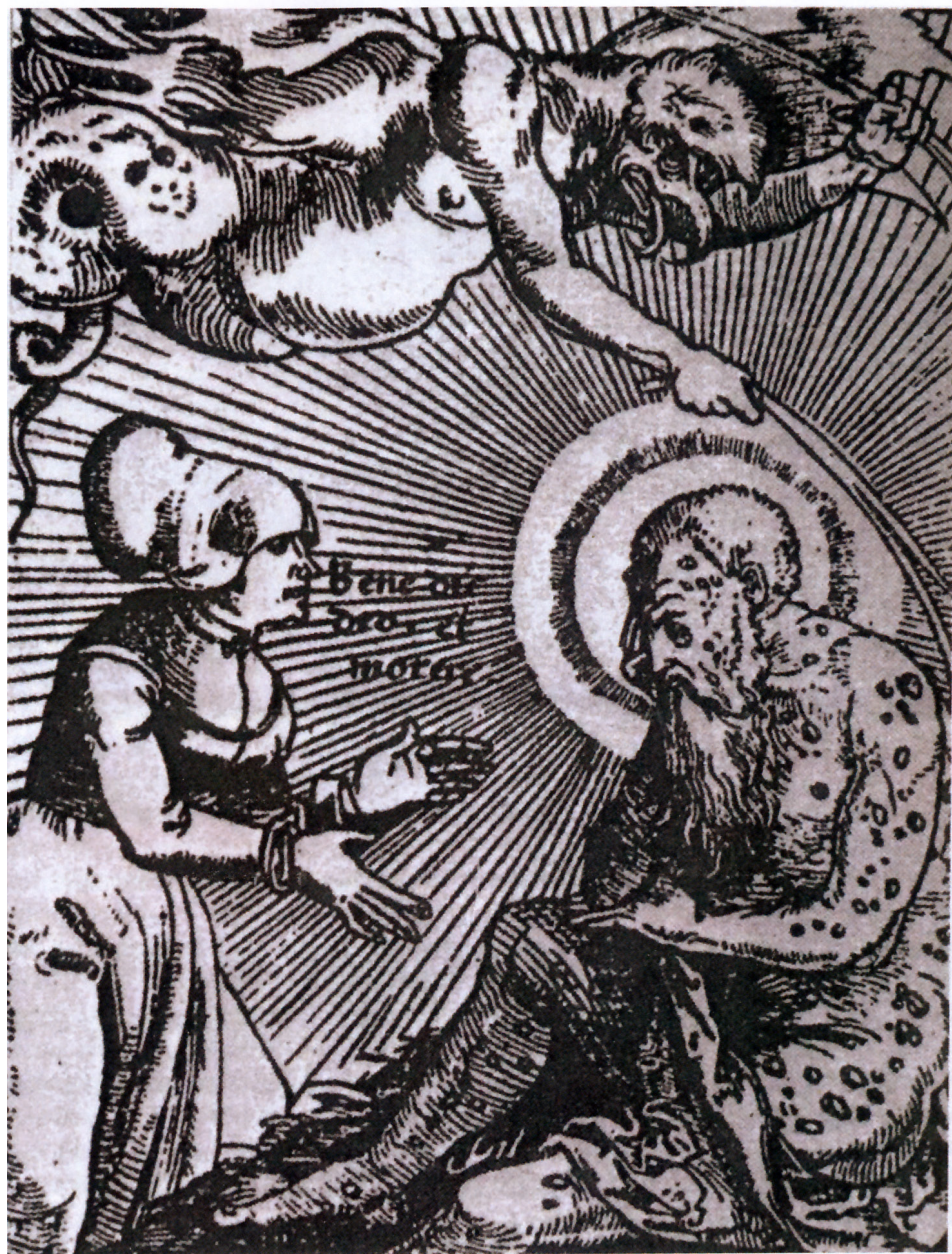
"Benedic deo et morere" (Lovpris Gud og vær tålmodig!) Træsnit af Hans Wechtlin. Billedet fremstiller Satan, som pisker spedalskhed på Job. (Jobs bog 2,7).