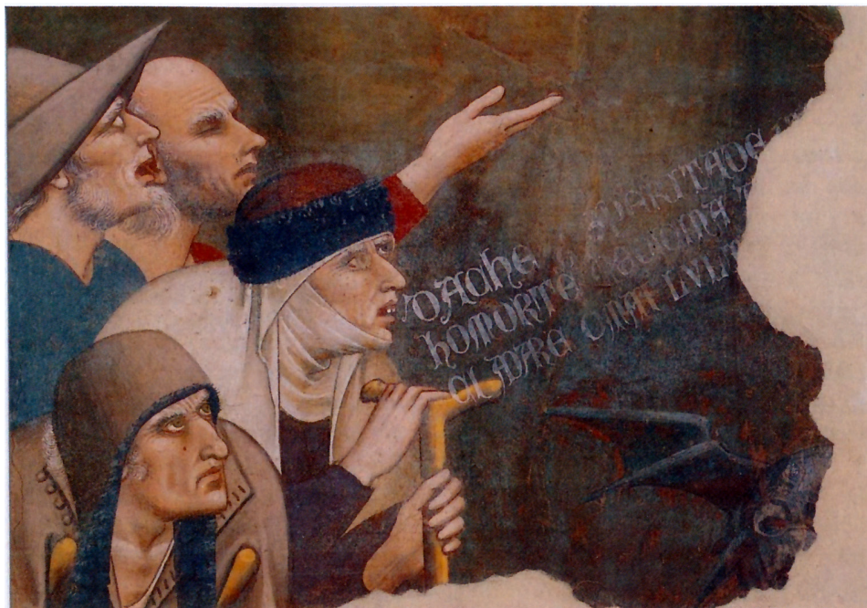
Udsnit af ældre billede med spedalske som motiv fra 1300-tallet. Fresken kaldes "Dødens triumf". Det er malet af Andrea Orcagna og befinder sig i museet Santa Croce i Firenze.