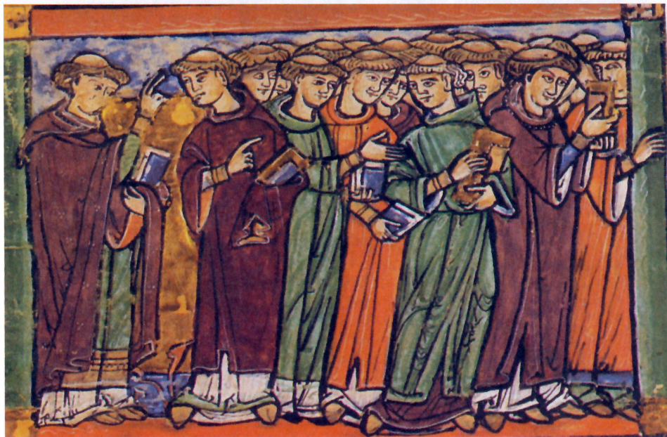
Miniaturemaleri af munke. (Fra Kjærsgaards Danmarkshistorie.)

Ordenen opstod, fordi der fremkom ønske om at højne det intellektuelle og moralske niveau hos de mange tusind præster, der ikke var munke. Det kunne være landsbypræster, præster ved kongers eller fyrsters kapeller, ved almindelige bykirker eller ved de store domkirker. Reformfolk foreslog, at