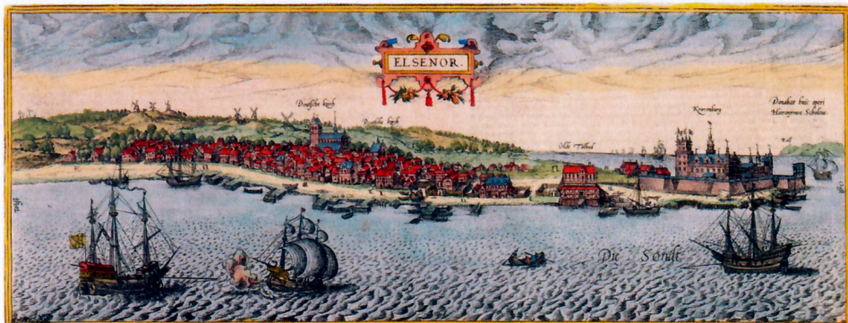
Helsingør år 1582 med Kronborg, toldboden, byen med Danske Kirke og Tyske Kirke og møllerne i baggrunden. Tegning af Hans von Knieper.

Indtil begyndelsen af det 17. århundrede hang der ikke megen billedkunst på danske vægge. Og slet ikke i borgerhjem. Det betød ikke, at stuerne var farveløse. Mange møbler var malede, oftest i rødt eller grønt, og ofte så gennemført, at man talte om en rød eller grøn stue. Der var kulørte hynder på bænke og stole, tæpper på borde og omhæng om himmelsenge. Og væggene kunne være smykkede med malede, mønstrede tapeter. Men billeder var der få af.