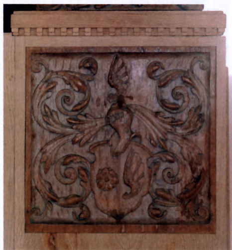
Familien Rosenvinges våbenskjold fra deres stol i Skt. Olai Kirke.