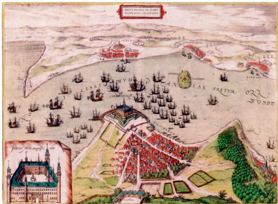
Prospektet viser øresundbyerne og den store trafik i Sundet omkring 1590. Dominerende i billedet er Frederik 2.s prægtige Kronborg. Fra Braun og Hogenberg, Verdens Byer.