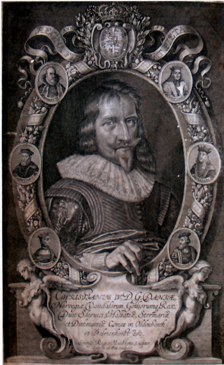
Christian 4. Fra indersiden af omslaget i den bibel der udkom 1633.

Antonimus, som var placeret ”wed Skorsteennen” regnes med her, måske blandt de kirkehistoriske. Fra nyere historie sås et billede af Hollands Triumf (søslag?). Desuden var der allegoriske billeder af våren og af menneskelivet (kobberstik). Endelig var der en lille rund tavle og fem kobberstik. Ingen af disse med angivelse af motiv. I alt var der 21 billeder i salen, som uden tvivl også med andre rum i boligen har været prydet med paneler og drætter (mønstrede tapeter).