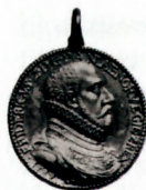
Medalje med Frederik 2. og dronning Sophies portrætter

Den lille sal var det rum i hovedgården, som var prydet af de fleste billeder, i alt 28. Mon ikke hovedstykkerne var de to