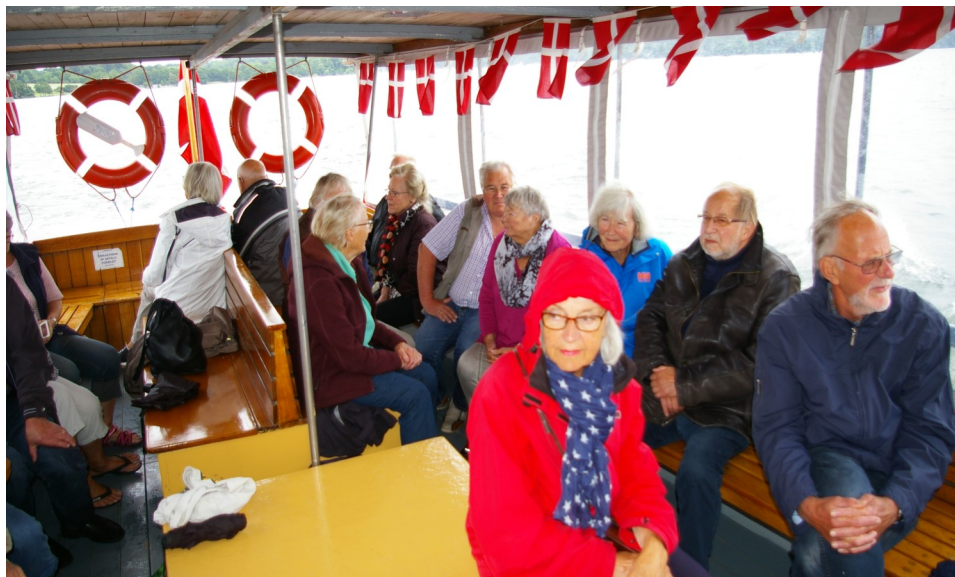
Foreningens udflugt d. 24. maj med sejltur på Furesøen startede i øsende regnvej, men båden var heldigvis overdækket. Og regnen holdt op under sejladsen.