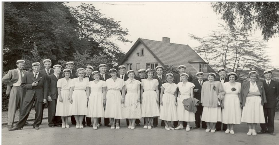
Studerer årgang 1951 fra Helsingør Gymnasium

Bag efter var vi i Chamonix og så bjerge for første gang. Vi boede på stor sovesal (2 sovesale) på et vandrehjem lige, hvor Mont Blanch tunnelen er i fag. Vi gik i bjergene hver dag fra morgen til aften. Efter Chamonix blev læreren i Frankrig, medens vi tog alene hjem over Martigny og Basel. Det var en stor oplevelse.