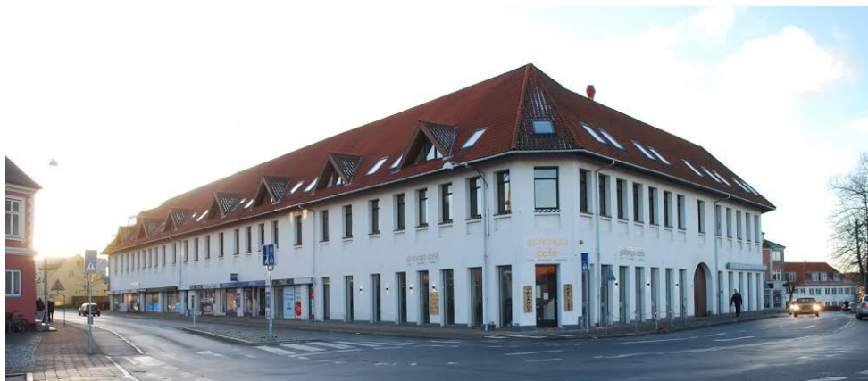
Hotel Leidersdorff er i slutningen af 1900-tallet blevet ombygget til ukendelighed, men den gamle køreport og forskellen på vinduernes placering ud imod Slangstrupgade afslører husets aner.