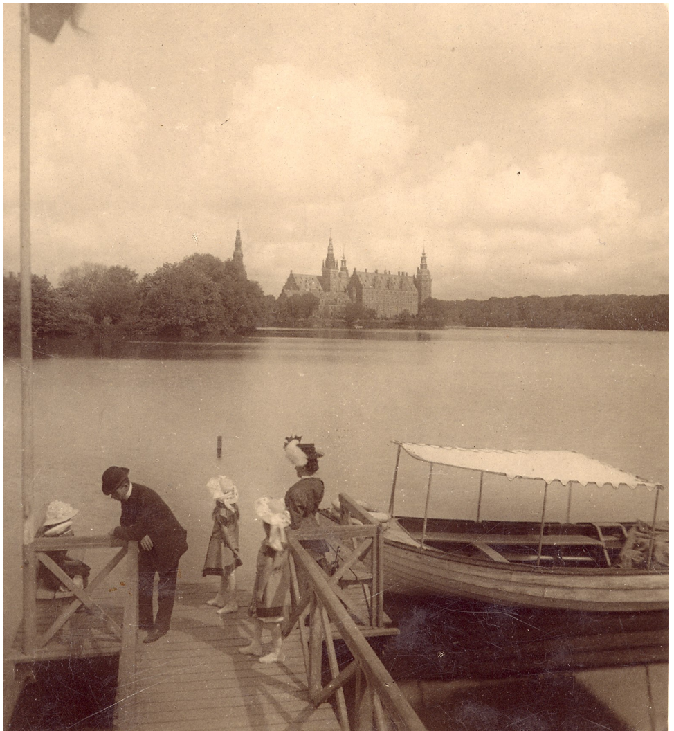
Sejlads på Frederiksborg Slotssø var en anden attraktion for hotellets gæster, hvis man ikke havde lyst til at gå på museum på slottet. Foto 1890. Hillerød lokalhistoriske Arkiv.

rengøring var også en vigtig del af hoteldriften. Hertil anvendte man en stab af stuepiger, muligvis også