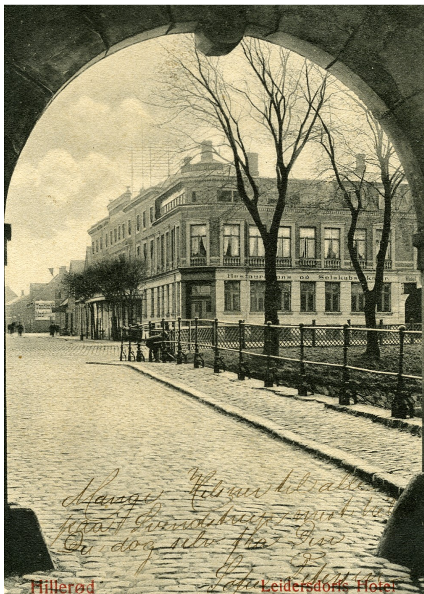
Hotel Leidersdorff set gennem Frederiksberg Slotsport på et postkort fra slutningen af 1800-tallet - endnu med påskrift på forsiden. Postkortet viser hotellets nære beliggenhed ved det nationalhistoriske museum på slottet, hvis gæster det skulle servicere.