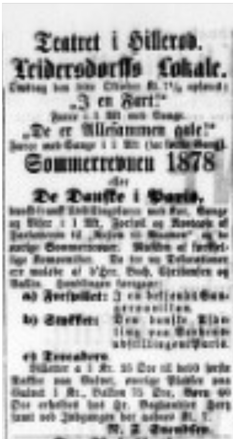
Avertissement for årets sommerrevy i Hillerød, bragt i Frederiksborg Amts Avis den 30. oktober 1878. Det er lidt sent på sommeren, men man havde åbenbart ikke en passende sal, før Hotel Leidersdorff åbnede.

stab af overtjenere, Imidlertid tjenerne og tjenerlever. Tjenerne fik ikke løn, men måtte leve af de drikkepenge, de kunne tjene. Til gengæld var de på kost i hotellet, lige-