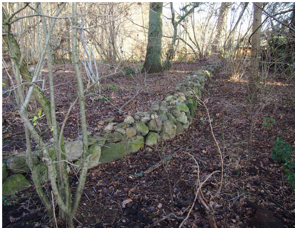
Fredskovforordningens stendige fra 1805. Ved yderkanten her fandtes der tidligere en grøft, som var med til at hindre kreaturer fra Stenstrup og Sauntes marker i at trænge ind i plantagen.

Her er også minder fra vor egen tid. På stranden ses resterne af tyskernes kystartilleri opstillet i 1940 til forsvar af indsejlingen til Øresund. Batteriet var