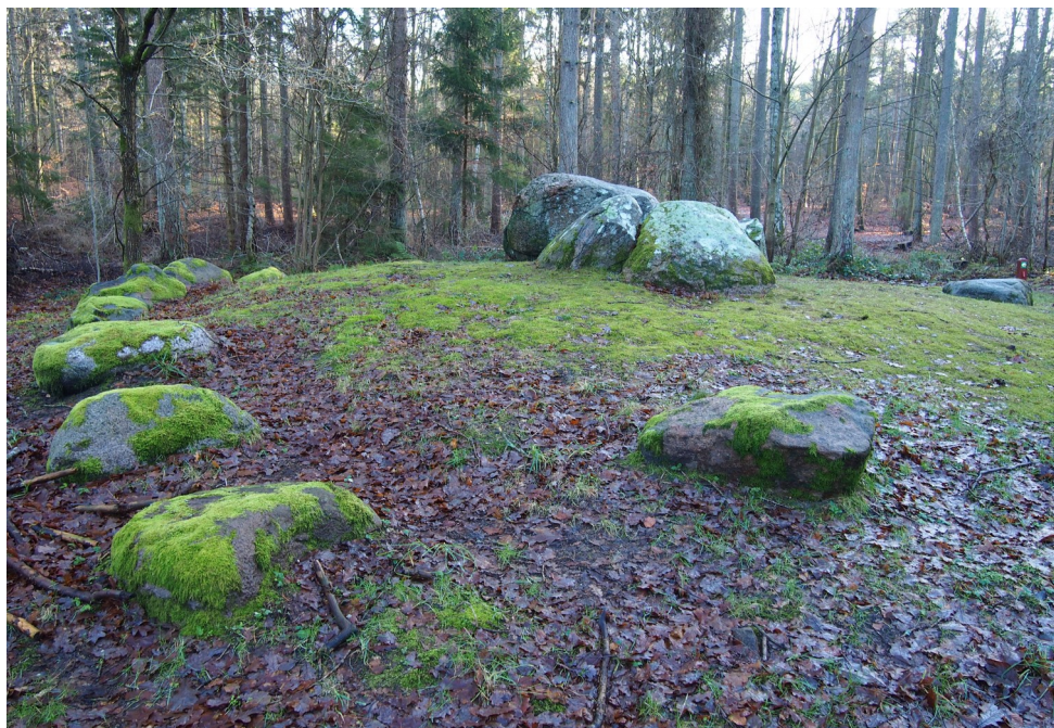
Midt i plantagen ligger en runddysse. Oprindeligt har gravkammeret været helt dækket af højen.

Offerstenen i nyere tid). Selve graven består af et rektangulært kammer, hvor kammerstenene bortset fra en enkelt står på deres plads. Graven er fra bondestenalderen 4.500 f.v.t. Den store overliggersten er forskubbet, men oprindeligt har der været endnu en sten, som helt har lukket selve gravkammeret. Antagelig har den fundet anvendelse som skærver ved vejanlæg eller fundamentsten ved senere tiders byggeri. Enkelte stykker hvidbrændt flint fortæller lidt om datidens gravskikke, idet hvidbrændt flint engang meget synligt og smukt har dækket højen. Graven er aldrig undersøgt. Et dejligt