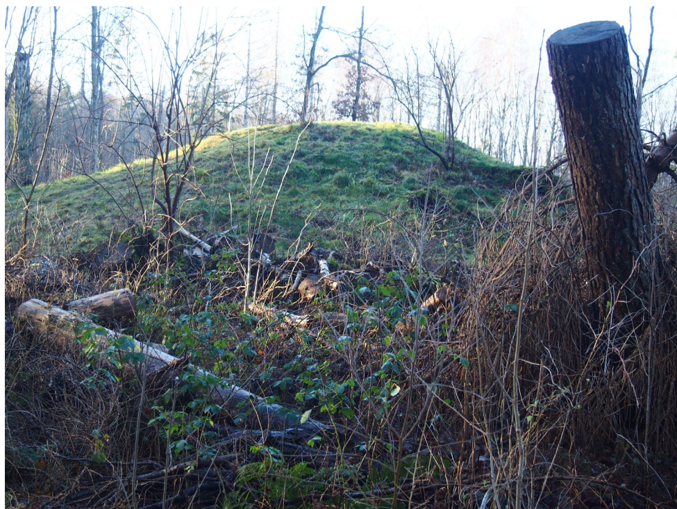
De store og små gravhøje er alle bygget af overfladejord, græstørv eller lyngtørv. Her ses en af de største høje næsten ude ved skrænten.