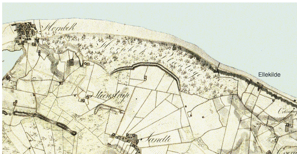
Kortet viser strækningen Ellekilde-Hornbæk 1824. Udsnit af Generalkvartermesterstabens kort opmålt i sommeren 1824. Det meget store sandflugtsdige ses i en bue nord for Stenstrup og Sautes jorde som afgrænsning af plantagen. Kort – og matrikelstyrelsen.

Men kampen mod sandet var begyndt allerede i begyndelsen af 1700-årene hvor man plantede marehalm og såede frø fra gran, fyr, pil, bøg og eg i den gamle Østerskov. Men det havde ikke stor virkning, da både kreaturer og vildtet gnavede løs, hvilket bevirkede, at der gang på gang gik hul på vegetationen, så sandlagene blev blottede og gav vinden frit spil til sandfygning.