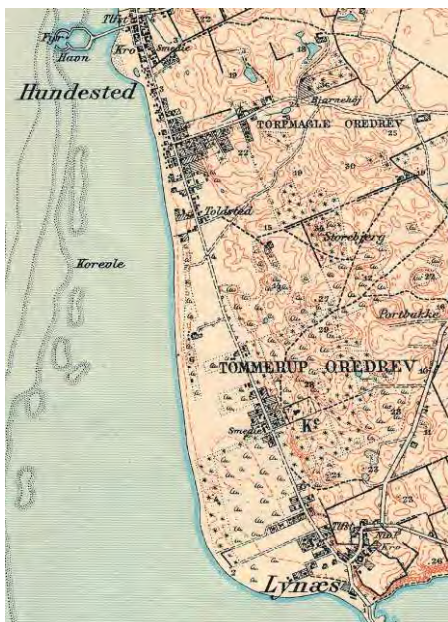
Udsnit af topografisk kort fra 1911 visende området mellem Lynæs og Hundested. Kirkebakken er markeret med angivelsen 28 (m.o.h.) umiddelbart nord for Lynæs Kirke (markeret med K°).

I årene 1905-06 var Kirkebakken stedet for en række forsøg indenfor elektroteknikken, nærmere betegnet den trådløse