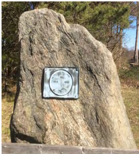
I 1969 lod Hundested Erhvervsforening en mindesten rejse på Kirkebakken. Mindepladen var skænket af Motorfabrikken.

Snart havde forsøgsstationen ved Lynæs løst sin opgave. En dag brød man op. Købmand Christian Petersen i Lynæs købte masten og huset for 500