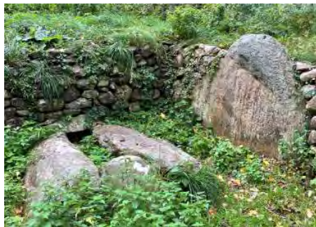
Dækstenen til gravkammeret, der i dag er forsynet med indhugget tekst af C.P. Ploug, er en del af gærdet. Nederst ses gravkammeret.

gavlsten. Gravkammeret ligger uden dæksten. Men dækstenen, som har hørt til graven, er væltet til siden og står nu oprejst med den helt flade underside, hvis største bredde på 2 m og største højde på 1,60 m, vendt ud mod højens åbning i højens sydlige side. Dækstenen holder, sammen med de mange håndstore sten, på højfylden.