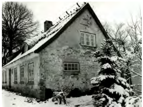
Den gamle rytterskole i Gørløse. Fotografi Keld Kayser 1969. Nationalmuseet.

Artiklen tidligere publiceret i Jul i Nordsjælland 1959