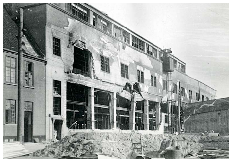
Riffelsyndikatet i Frihavnen efter BOFA's bombing i juni 1944.

Men havde det nu også det? Var der mere i valget af Kantarelvvej 1 end blot det at hævne Banner-Jansens nedbrændte sommerhus? For at svare på dette spørgsmål skal vi en tur til Østerbro.