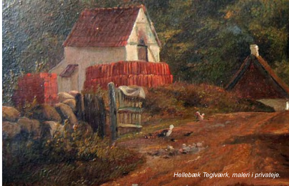
Hellebæk Teglværk, maleri i privateje.