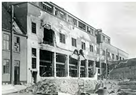
Riffelsyndikatet i Frihavnen efter BOFA's bombing i juni 1944.

Men havde det nu også det? Var der mere i valget af Kantarelvvej 1 end blot det at hævne Banner-Jansens nedbrændte sommerhus? For at svare på dette spørgsmål skal vi en tur til Østerbro.