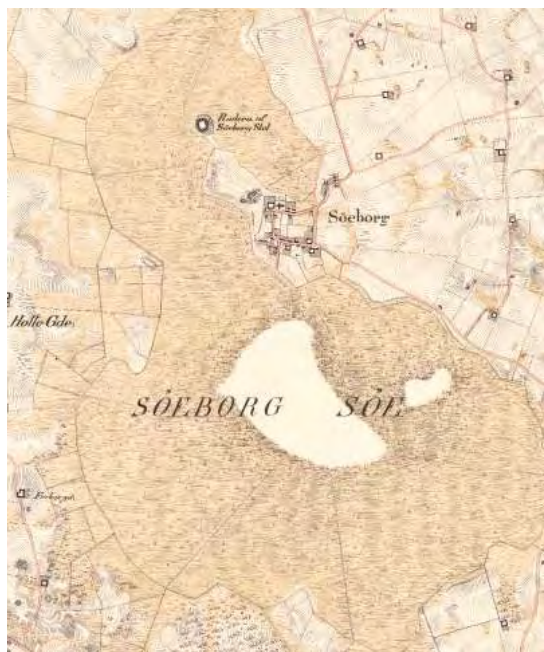
Udsnit af Generalkvartermesterstabens kort fra 1824 visende Søborg Sø med Klaringen (det lyse område i midten), hvor Søen Kierkegaard og hans ven har kunnet stage sig frem i båden. Kort- og Matrikelstyrelsens arkiv. Fotografiet nederst viser Søborg Sø set fra højdedraget i Dragstrup.