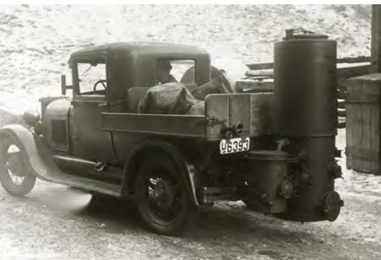
Gasgeneratoren betød at man kunne udnytte den gas, der er i træet, når det brænder og dermed erstatte den sparsomt tildelte benzin. Det kostede til gengæld ganske store skovområder. Fotograf fra ca. 1942.