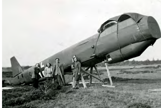
Fly-atrap under opbygning i Melbylejren under krigen.

Straks efter besættelsen den 9. april rykkede tyskerne nemlig ind i Melbylejren og begyndte kort efter en hektisk byggeaktivitet. Der blev bygget adskillige nye mandskabsbarakker, køkkenfaciliteterne blev udvidet, og ude på selve skydeterænet støbte man en mængde små beton-bunkers, der var åbne på den side, der vendte ud mod stranden og havet. De blev camoufleret med græstørv. Fra disse bunkers med løbegrave til hver side kunne man betjene forskellige bevægelige skydemål. Desuden blev der tæt ved lejren bygget et højt observationstårn på en solid tømmerkonstruktion. To andre observationstårne blev opført ude i klitterne med et par hundred meters afstand. Midt imellem disse anbragte man et stort fast skydemål, der skulle beskydes af lavtflyvende jagerfly med maskingeværer. Det bestod af lange flade lodrette brædder med mellemrum imellem, så vinden kunne fare igennem. De var hvidmalede og dannede en nøjagtig silhouet af en stor fragtdamper. Længden var mindst hundrede meter, og op til »skorstenens« øverste kant var der vel 15-20 meter. Ned over dette mål dykkede så Messerschmitt jagere eller lette to-motors Heinkel bombemaskiner og affyrede deres maskingeværer. Bagef-