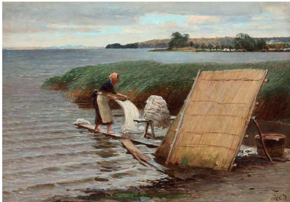
Efter at tøjet var blevet bøget og havde ligget natten over i bøgehytten (vaskehuset), blev det fortsat varme tøj på trillebør kørt ned til Esrum Sø for at blive skrubbet, skyllet og banket for bøgeluden. Maleri af Hans Ole Brasen, 1888. Privateje.

samme familie i flere generationer. Ægteskaber blev ofte indgået indenbys, hvor begge ægtefæller kom fra Sørup, hvorved familierne i Sørup var fint flettet ind i hinanden. Der var derfor også et klart indbyrdes samarbejde om vaskeriet. Alle i familien deltog i arbejdet, og de større vaskerier havde foruden familien også ansatte piger til hjælp.