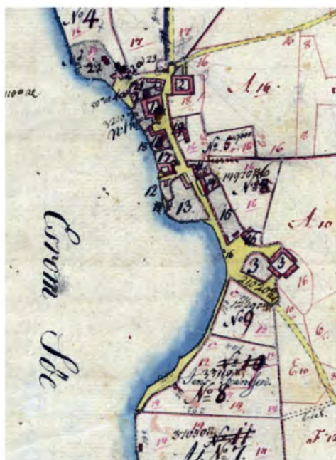
Udsnit af matrikelkort over Sørup, opmålt i 1816.