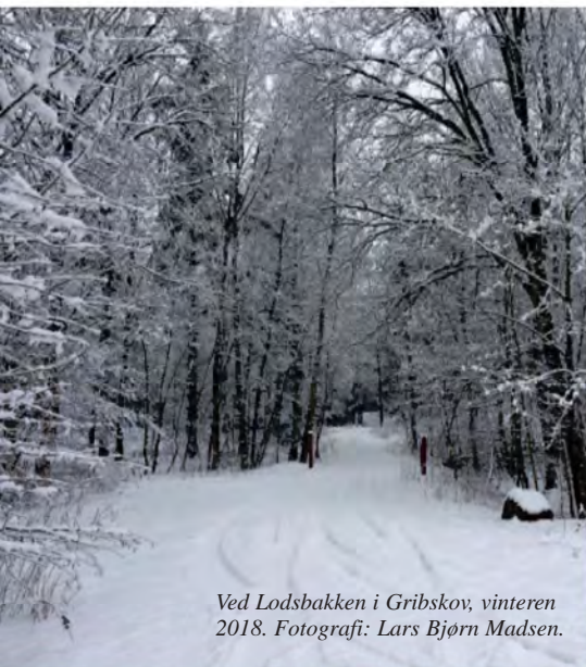
Ved Lodsbakken i Gribskov, vinteren 2018.