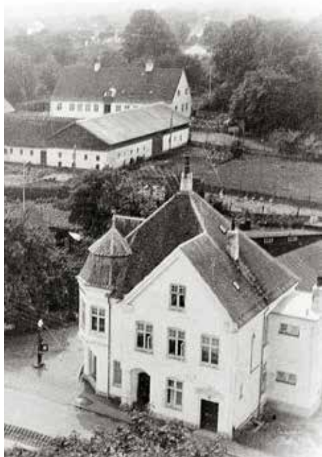
Hvide Hus i Græsted med præstegården i baggrunden. Fotografii 1938. Gribskov Arkiv.

egentlig købmandsdrift, men det var lovligt at afholde spækhøkeri i landsbyer, som lå tilpas langt fra købstæder, hvis de holdt sig til blot at sælge blandt andet flæsk, skinker, pølser, høns, gæs, æg, smør, mel, brød, øl og – frem for alt - brændevin. Der var derfor også mindst én spækhøker i Græsted og dette er nok det tætteste, vi kommer på at vide noget om, hvor bønderne skaffede dette vigtige fluidum – vel at mærke, når de ikke brændte det selv. Ulovligt, selvfølgelig.