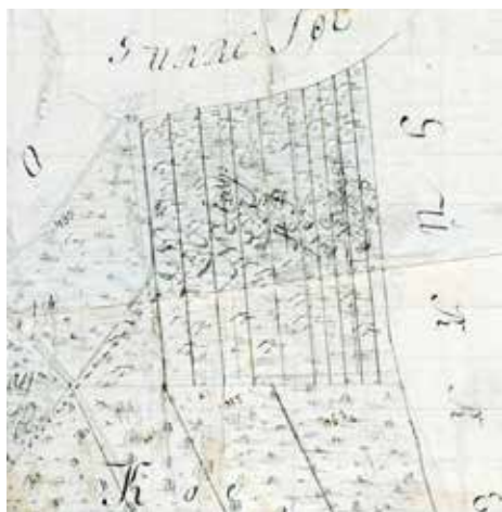
Ved udskiftningen af Tikøb i 1787 blev der afsat en række smalle tørvelodder ved Tikøbbugten i den sydvestlige del af Gurre Sø til bønderne. Stadig kan man se de vandfyldte huller i Sømosse, hvor tørvene blev gravet; senest under anden Verdenskrig. Udsnit af udskiftningskort. Matrikelstyrelsen.

Når de færdige tørv havde nået en bestemt fugtighedsgrad, skulle de »kant« . Det vil sige, at de stilledes på kant. Det kunne børn hjælpe til med. Så tørrede de lidt igen. Og så skulle de »skrues«, hvilket vil sige, at de blev sat op i såkaldte »skrues«, der var hule indeni. Alt skulle klares i konkurrence med andre gøremål i bondens arbejds-