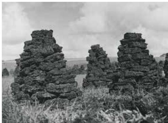
Tørsven er skruet; altså sat i små kegleformede stakke.