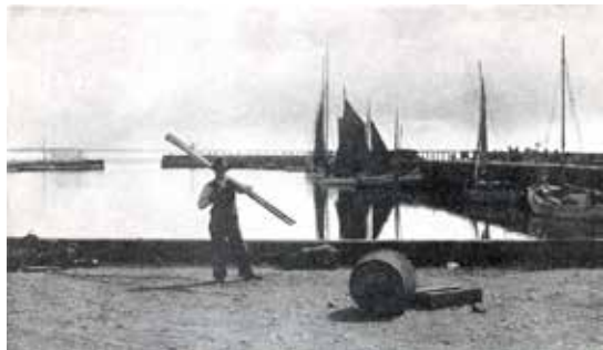
Den gamle Lynæs Havn.

Om Efteraaret før Sildefisket havde vi noget, der blev kaldt Ophalingsgilde. Et Par Drengene blev sendt ud for at »sige til«. Den ene gik mod Store Carlsminde, den anden mod Hundested. Gildet, der stod paa Havnen, foregik, mens Baadene blev halet op for at blive eftersat og rensat. Saadan et