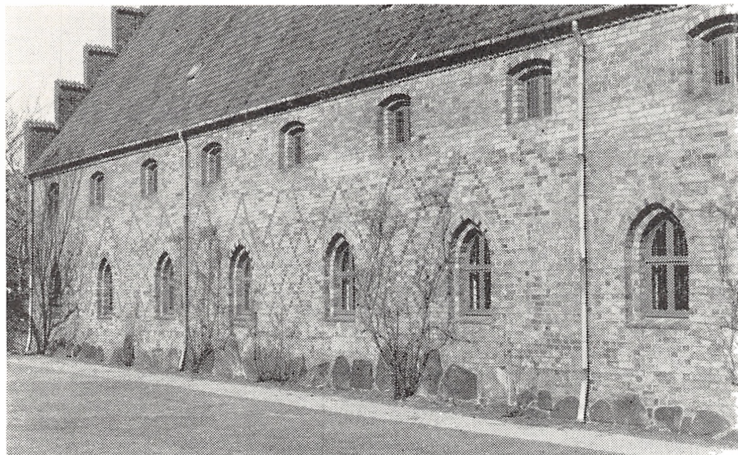
Den fløj af karmeliterklostret, hvori Helsingør latinske skole havde til huse.