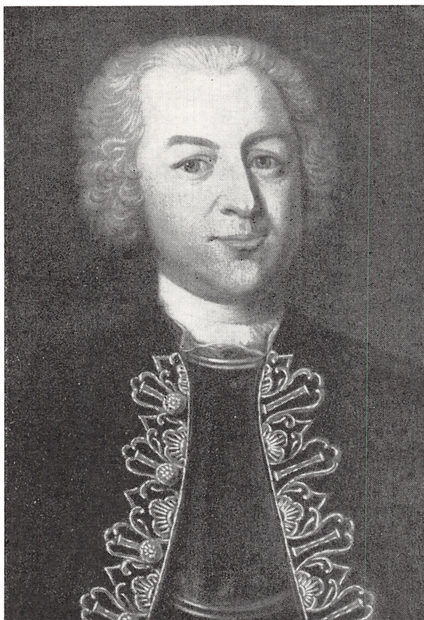
Fig. 3. Johann Georg von Langen. Efter maleri i Herzog-Anton-Ulrich-Museum i Braunschweig. Ukendt maler, ca. 1750.

Johann Georg von Langen var en af de mærkelige personligheder, der kan alt.