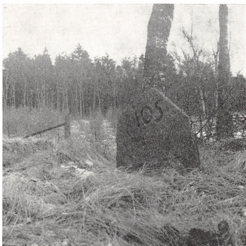
Fig. 6. Langensk afdelingssten, der er løsrevet fra sin oprindelige plads. Den stod på Kronborg Revir i hjørnet af afdeling 105, der hører til det nuværende Esrom Skovdistrikt. Fot. 1964.

(s. 44) florerede skovtyveriet. Tidligere havde tyvene så godt som altid måttet gøre sig den ulejlighed selv at hugge det brænde, som de førte til torvs. Efter den ny ordning skulle brændet opstilles i favne, og der blev altså mulighed for at komme endnu lettere til en arbejdsfri indtægt ved at stjæle det opstillede favnebrænde. For at imødegå dette udstedte kongen „Plakat af 8. november 1765 angående dem, der bortstjæle tømmer og opstabet brændeved i Hans Majestæts skove.“