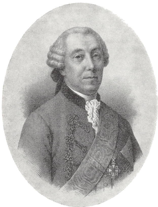
Fig. 2. Overjægermester C. C. Gram. Efter litografi i Ch. Lütken: „Den Långenske Forstordning“, 1899.

Resultatet af Grams brevveksling med von Langen blev, at denne, der på det tidspunkt havde visse vanskeligheder i Brunsvig, selv tilbød sin tjeneste, blev engageret og kom til Danmark året efter, d. 13. oktober 1763.