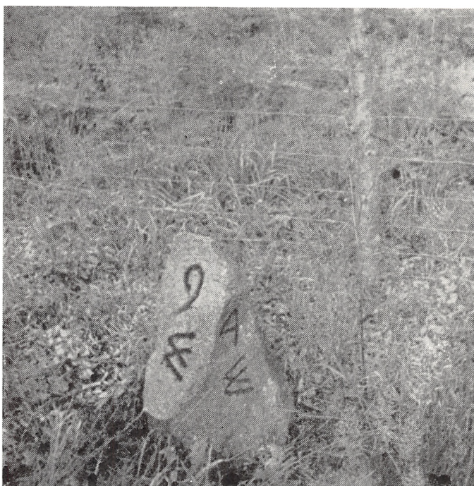
Fig. 5. Langensk afdelingssten fra Ganløse Ore; stenen står endnu på sin oprindelige plads i den sydlige del af skoven. Inskriptionen på stenen er trukket op med mørk farve, som det også skete kort efter, at behugningen havde fundet sted. Tallene og bogstaverne betyder, at man vest for stenen har afdelingerne 4 og 9. På de andre to flader af stenen er indhugget 0. 5 og 0. 10, der betyder øst 5 og øst 10. Stenen står i hjørnet mellem de Langenske afdelinger 4, 5, 9 og 10. Fot. 1963.

som tidligere havde været det almindelige. Mens aflønningen hidtil havde bestået af en lille fast gage og visse beløb for hvert skovlæs, der blev udvist, bør den efter den ny forst-ordning være fast. Der bør indstiftes æres- og nådestegn for de skovbetjente, der udmærker sig særligt.