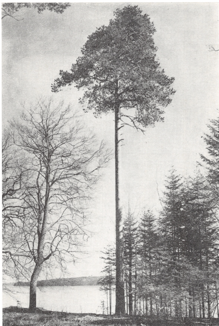
Fig. 8. Skovfyr fra den Langenske plantage i Nødebo Holt; Esrom Sø i baggrunden; træet blev plantet i slutningen af 1760'erne. Statens forstlige Forsøgs-væsen fot. 1922.