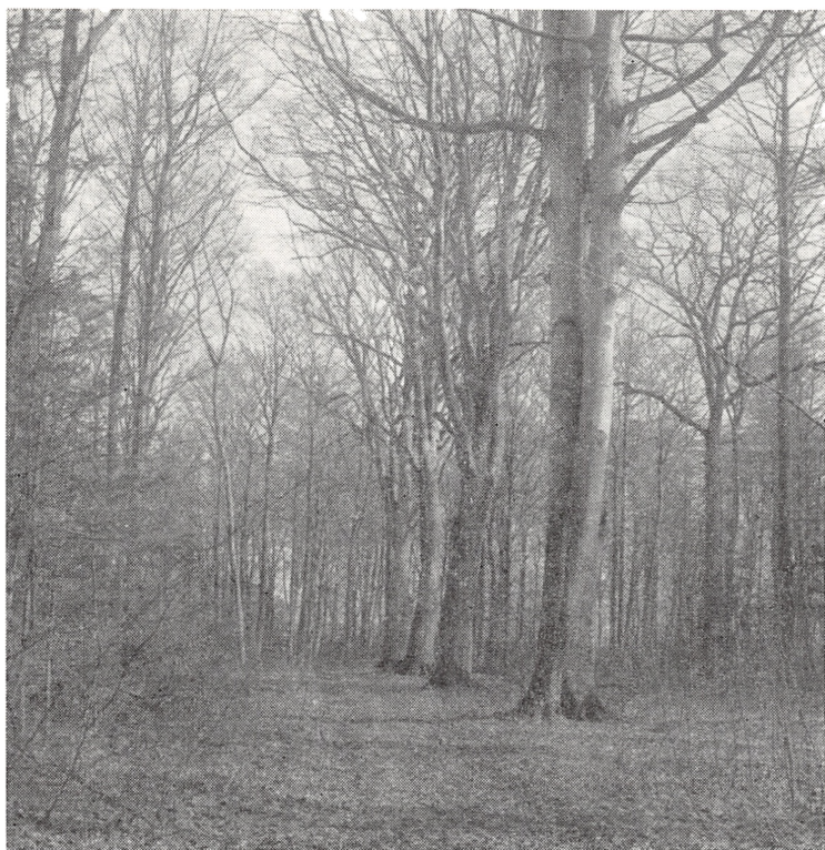
Fig. 10. I Store Lyngby Skov findes en række gamle bøge, der er rest af den derværende Langenske plantage. Fot. forår 1964.

I Nødebo Holt ved Esrom Sø findes en gruppe skovfyr, blandt disse Nordsjællands smukkeste, samt enkelte ege, der stammer fra plantninger og såninger, der blev udført 1765–1769.