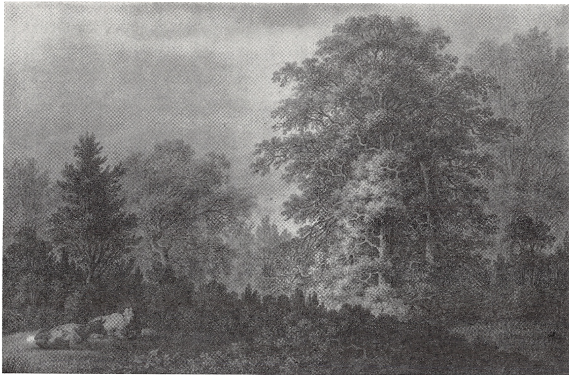
Fig. 1. Skovparti med drøvtyggende køer. Vi ser her den typiske uensaldrende græsningsskov med forbidte opvækstgrupper i forgrunden. Efter tegning af S. Mygind, 1814, Kobberstiksamlingen.