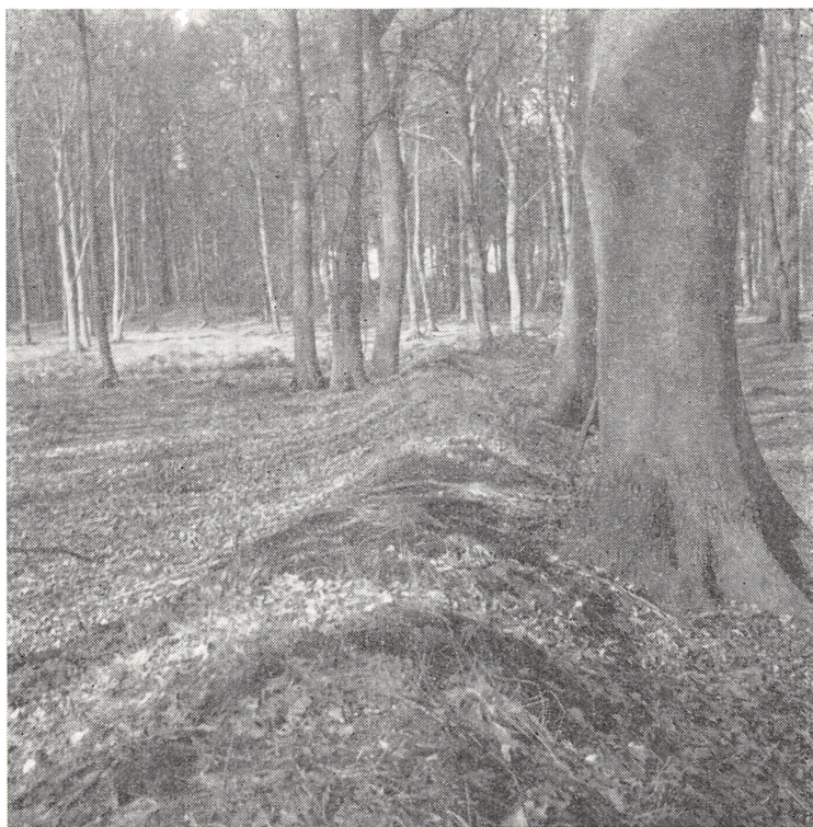
Fig. 12. Jordvold i Brøde Skov. Denne vold blev opkastet i nordkanten af den oprindelige Langenske plantage. Til yderligere beskyttelse for plantningen har der formentligt været et risgærde eller anden form for hegn ovenpå volden. Iøvrigt blev der i vid udstrækning anvendt lægtehegn ved indhegningerne. Fot. 1964.

ningen af den Gram-Langenske periode – jordvolde langs kanten af en del Langenske plantager. I adskillige skove kan sådanne jordvolde endnu påvises. Disse volde fulgte afdelingsgrænserne, der var drejet ca. 15^\circ mod vest i forhold til retningen syd-nord og ca. 15^\circ mod syd i forhold til retningen øst-vest. Sammenlign omtalen af kompasmisvisningen s. 61.