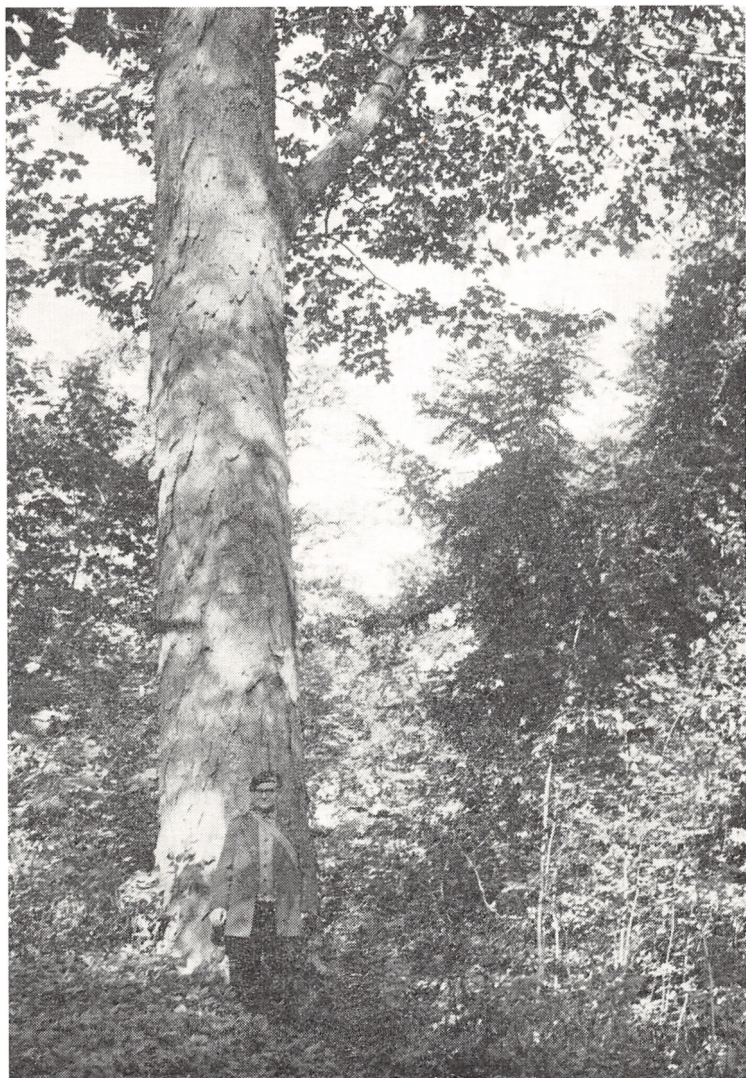
Fig. 11. Langensk ær i Ganløse Ore. I løbet af de 200 år, der er gået, siden von Langen indførte æren eller ahornen i de nordsjællandske skove, har den bredt sig ved naturlig foryngelse, således at den i vore dage danner undervæksten mange steder i nærheden af de oprindelige plantninger. Også egentlige bevoksninger kan føres tilbage til den Langenske indførelse af træarten. Fot. september 1963.